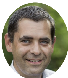
Michaël Weber, Président de la Fédération des Parcs naturels régionaux de France

Ces réflexions s'appuieront sur trois ateliers qui interrogeront les enjeux, les atouts et faiblesses des Parcs et leur propositions, dans une co-construction avec les acteurs des territoires urbains.