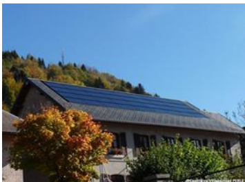
Centrales Villageoises Perle (La Thuile - 73)

De 2010 à 2015, des phases successives d'animation, d'études, de réalisation se succèdent. Les premières sociétés locales sont créées fin 2012 / début 2013. Administrées principalement par des citoyens, elles développent chacune un premier projet photovoltaïque constitué de groupements d'installations en toiture, implantées sur un territoire de projet, constitué de plusieurs communes. La population locale est progressivement mobilisée, ainsi que les collectivités et les acteurs économiques. En 2014, le premier projet solaire entre en service dans le Parc naturel régional du Pilat, suivi bientôt par d'autres. A fin septembre 2016, 6 projets photovoltaïques sont en service pour une puissance cumulée de 420 kWc répartie sur 48 installations. D'autres mises en service sont attendues dans les mois qui viennent.