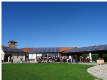
Centrales Villageoises Région de Condrieu (Les Haies - 69)