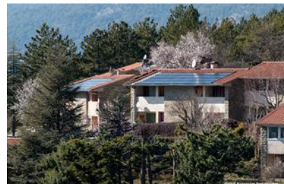
Centrales Villageoises Rosanaises (Rosans - 05)

Depuis 2014, l'essaimage a démarré dans d'autres territoires, notamment en Provence-Alpes-Côte d'Azur, mais toujours via les PNR. Les Parcs naturels régionaux du Queyras et du Luberon ont ainsi été les premiers à tester les outils du modèle Centrales Villageoises, expérience qui a mené rapidement (début 2016) à la mise en service d'un projet de 10 installations dans le Queyras. Depuis, d'autres territoires, dans et hors PNR, se sont lancés et on compte aujourd'hui 17 territoires officiellement impliqués dans une démarche de Centrales Villageoises. Le modèle s'exporte désormais hors des frontières rhônalpines, et rencontre un succès particulier auprès des territoires engagés dans la démarche Territoire à Energie POSitive (TEPOS) avec lesquels la démarche est cohérente. Enfin, les sociétés Centrales Villageoises ayant déjà un projet en service s'attaquent aujourd'hui à la réalisation de nouvelles tranches de projets.