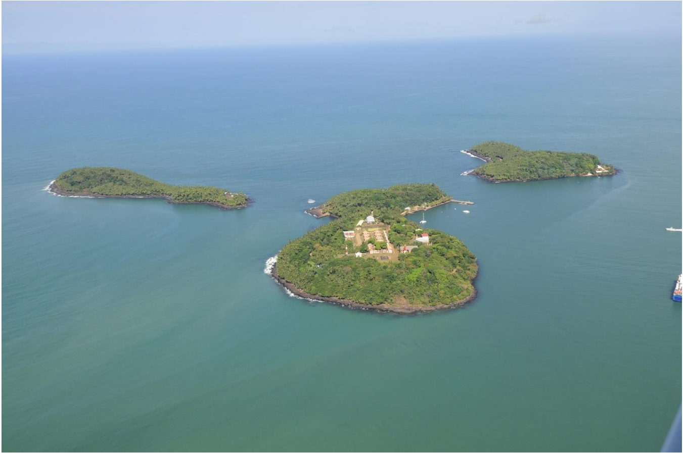
19. Les îles du Salut