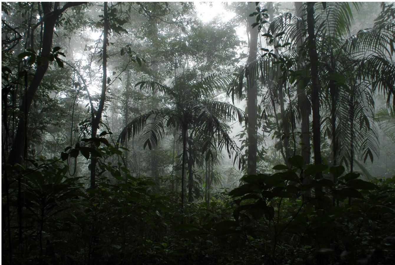
« Forêt de brume » dans la Réserve naturelle régionale Trésor, Roura