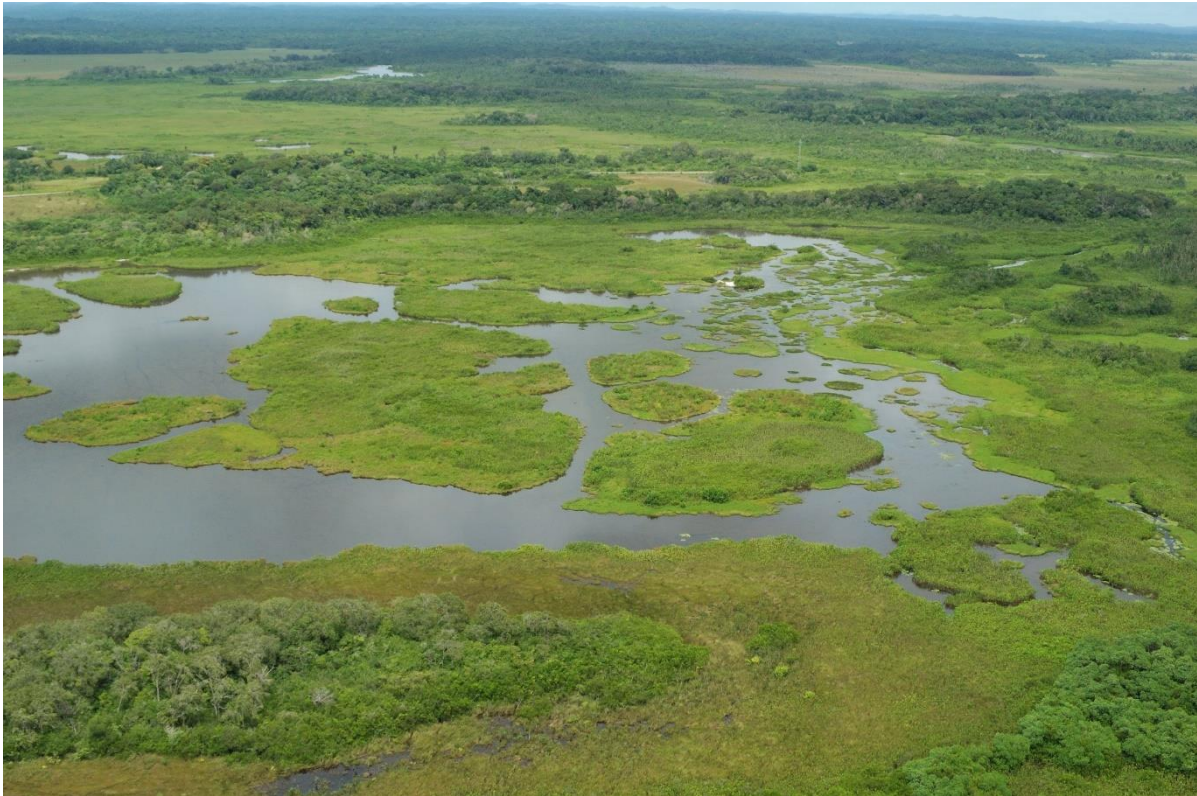
20. Les marais Yiyi, Sinnamary