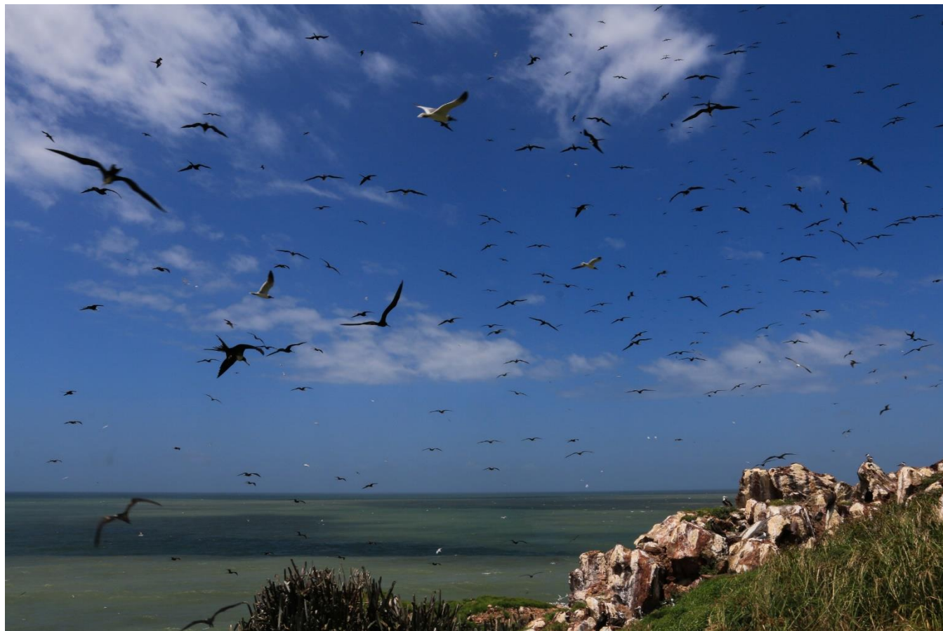
Réserve naturelle de l'île du Grand Connétable