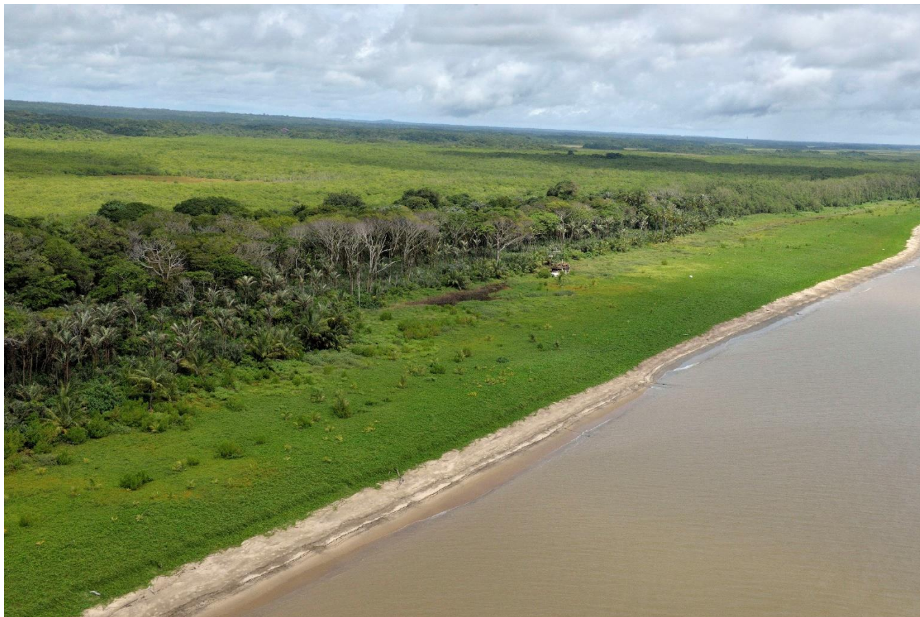
18. Grande plage sur le littoral du Centre Spatial Guyanais, CNES