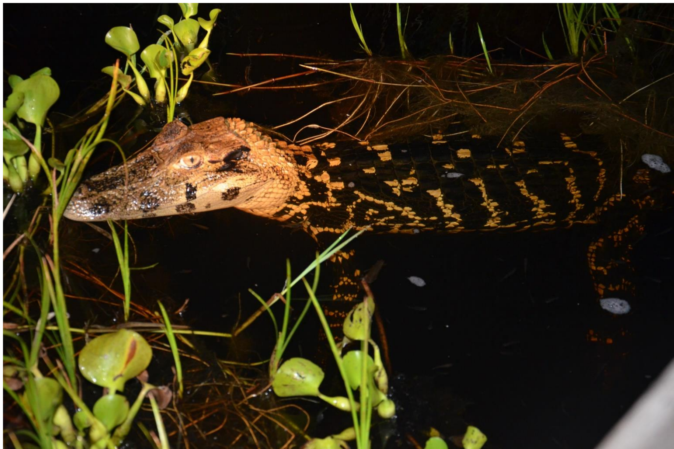
15. Caïman noir, Melanosuchus niger , Réserve naturelle Kaw-Roura