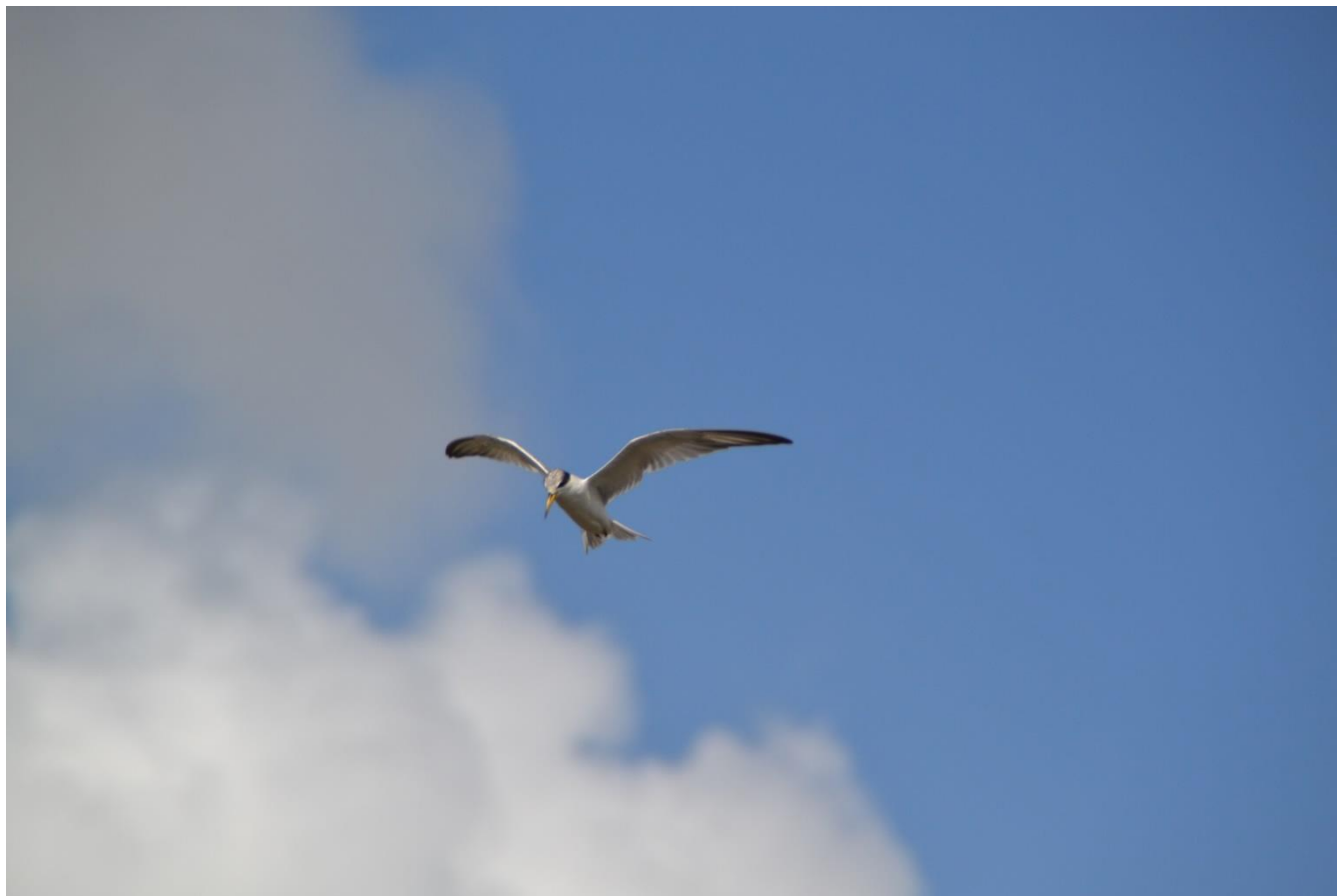
Sterne argentée, Sterna superciliaris, Réserve naturelle de Kaw-Roura