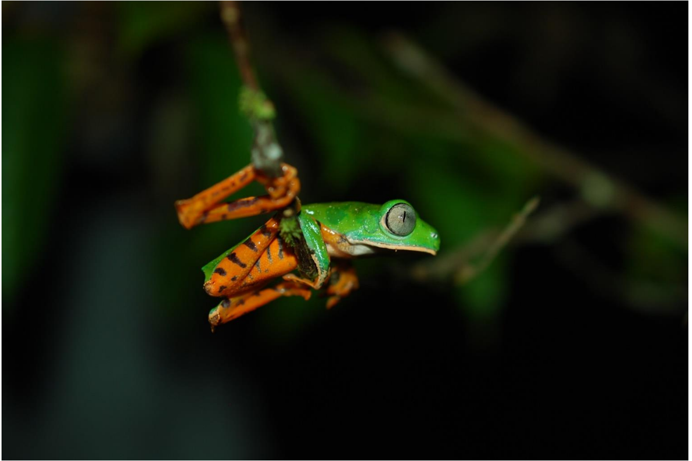
12. Phyllomedusa tomopterna - Rainette de Cope , Kaw