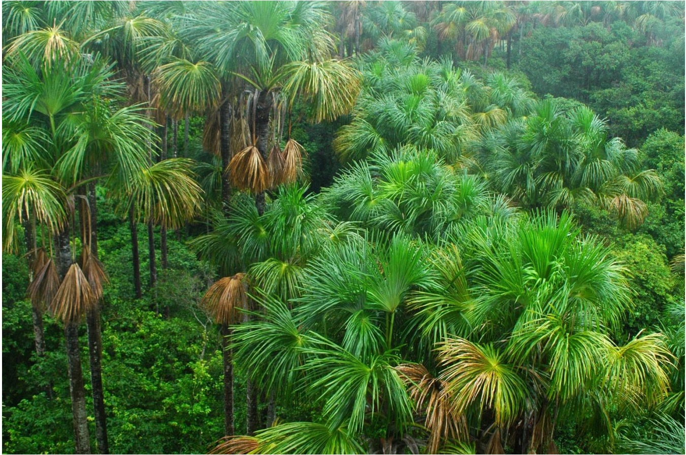
5. Forêt de Palmiers bâche, Mauritia flexuosa