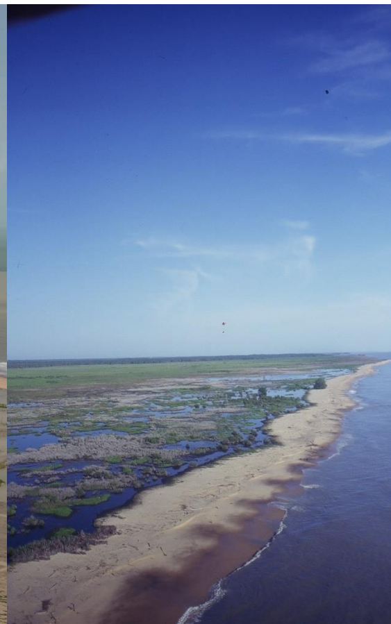
Erosion dans les rizières de Mana, plage d'Organabo