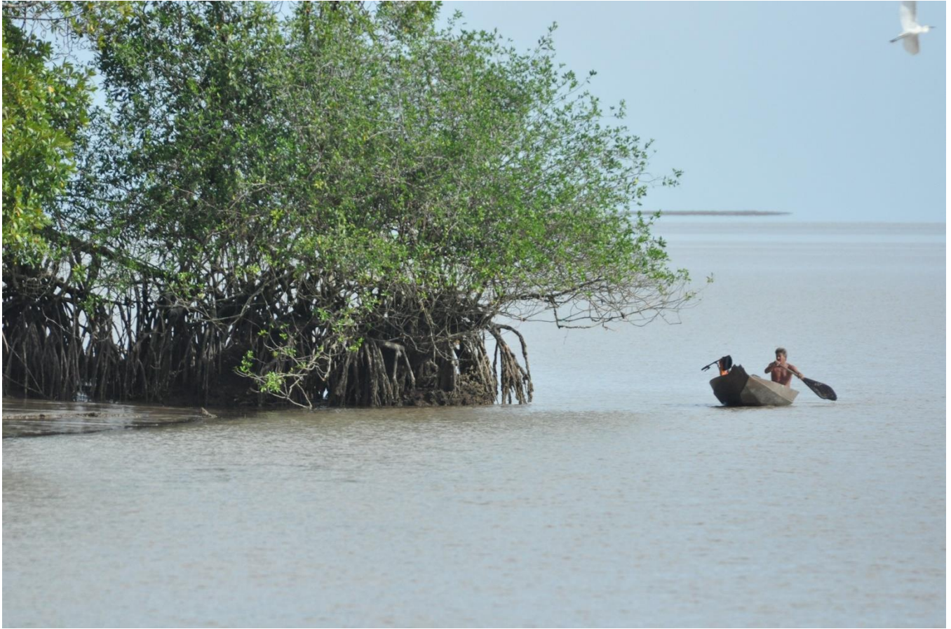
2. Estuaire de la rivière Ouanary, expéditions scientifiques Oyapock Nature (OYANA) du PNRG