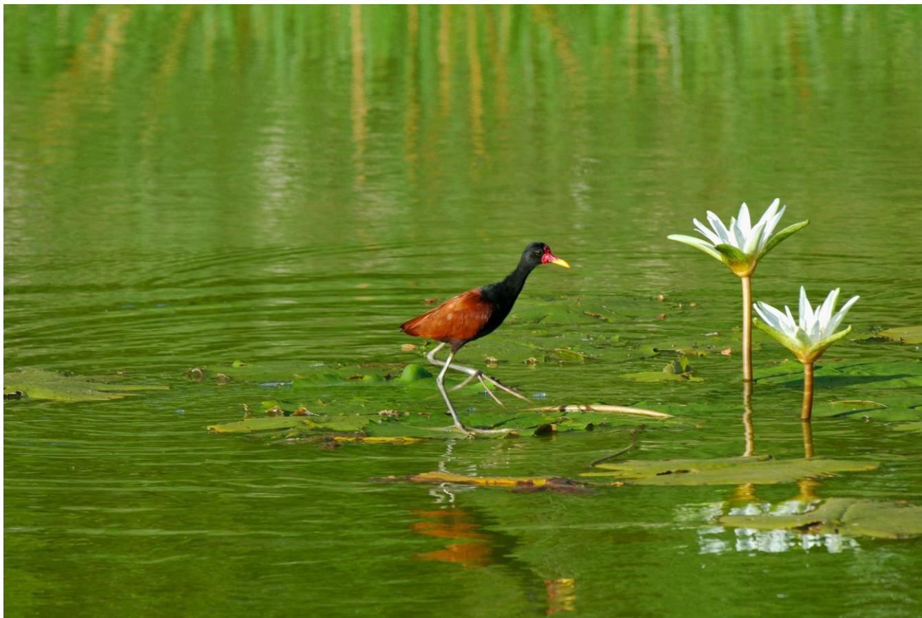
13. Jacana noir, Jacana jacana, Réserve naturelle de Kaw-Roura