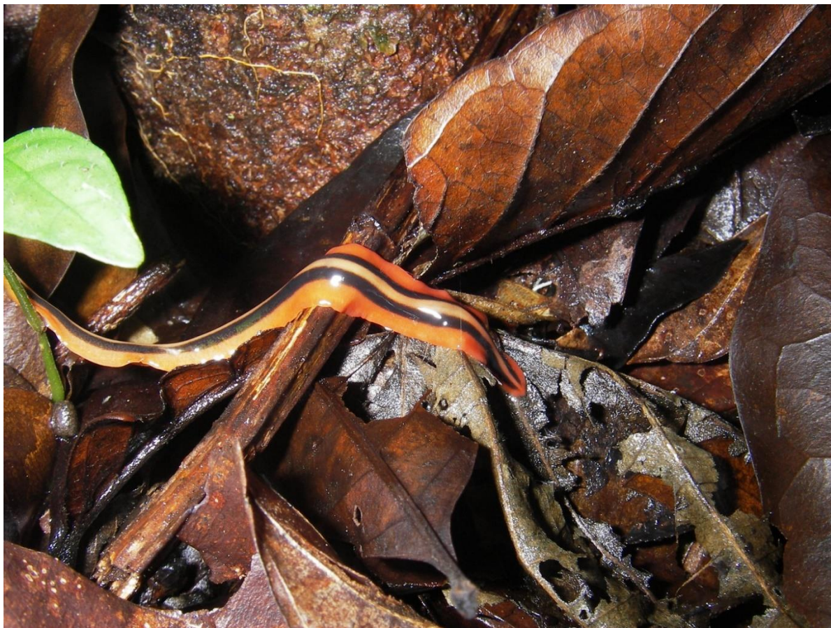
7. Planaire du genre Pseudogeoplana