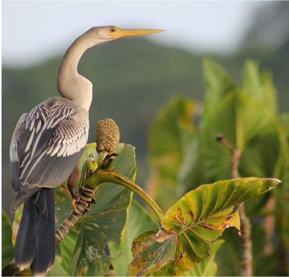
1. Aninga d'Amérique, Réserve naturelle nationale de Kaw-Roura