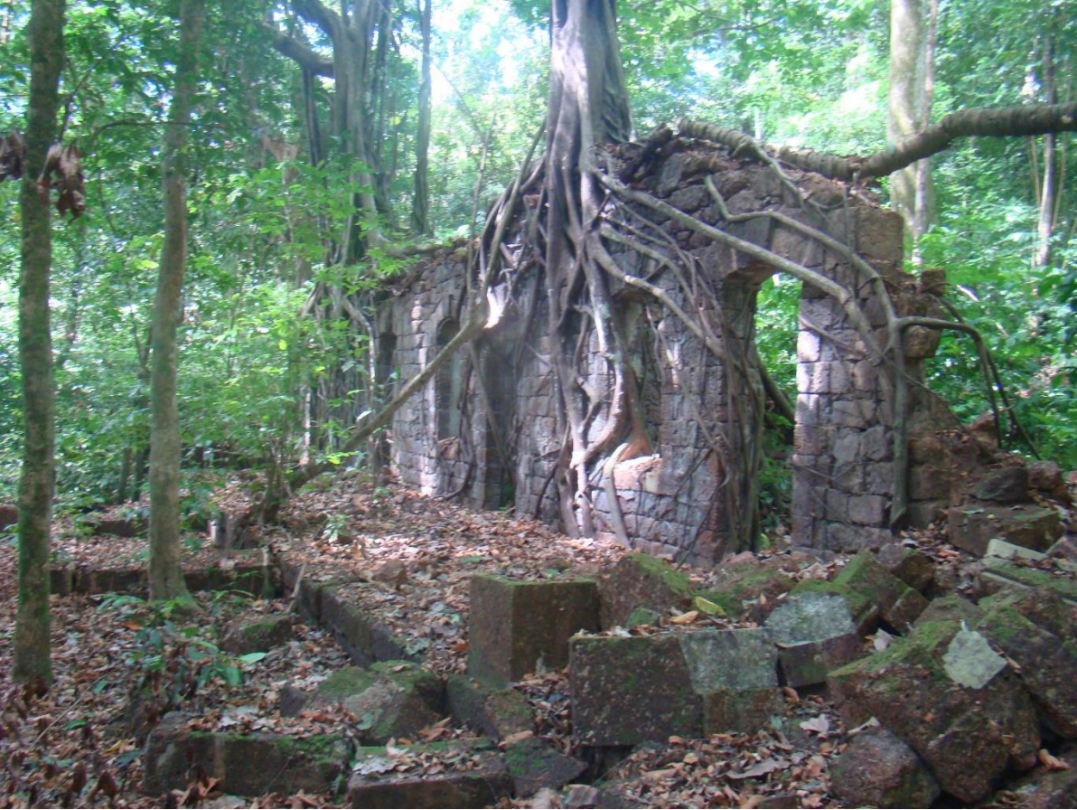
Vestiges du baigne de la Montagne d'Argent, Ouanary, expéditions scientifiques du PNRG