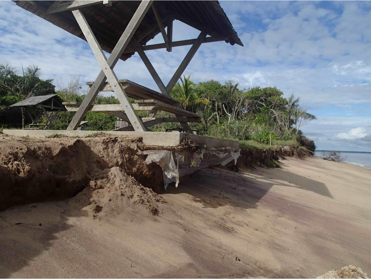
Erosion, plage à Awala-Yalimapo