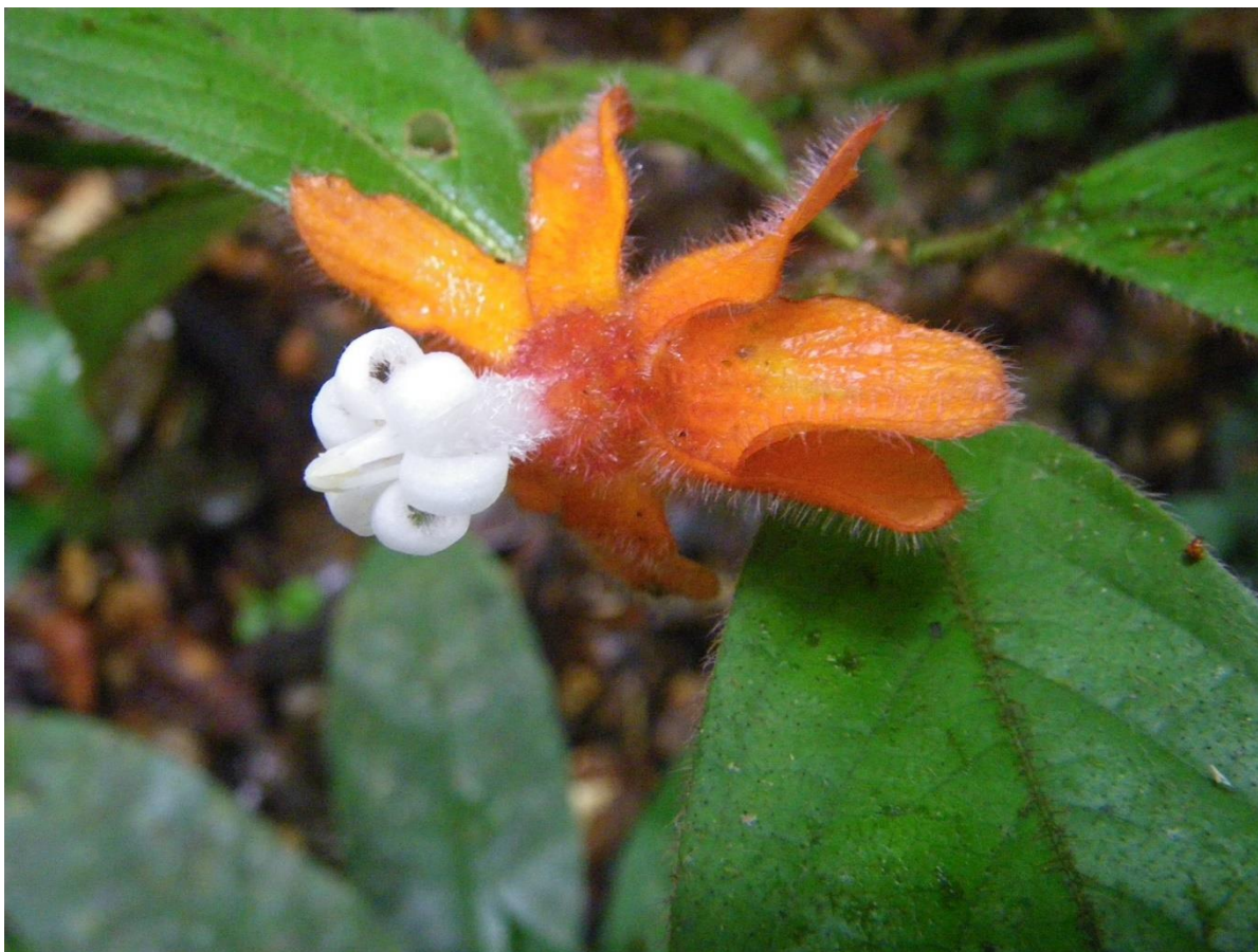
6. Espèce nouvelle de Rubiacée en cours de description