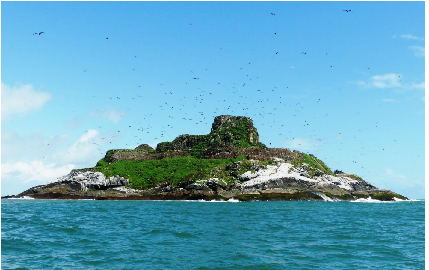
8. Réserve naturelle nationale de l'île du Grand Connétable