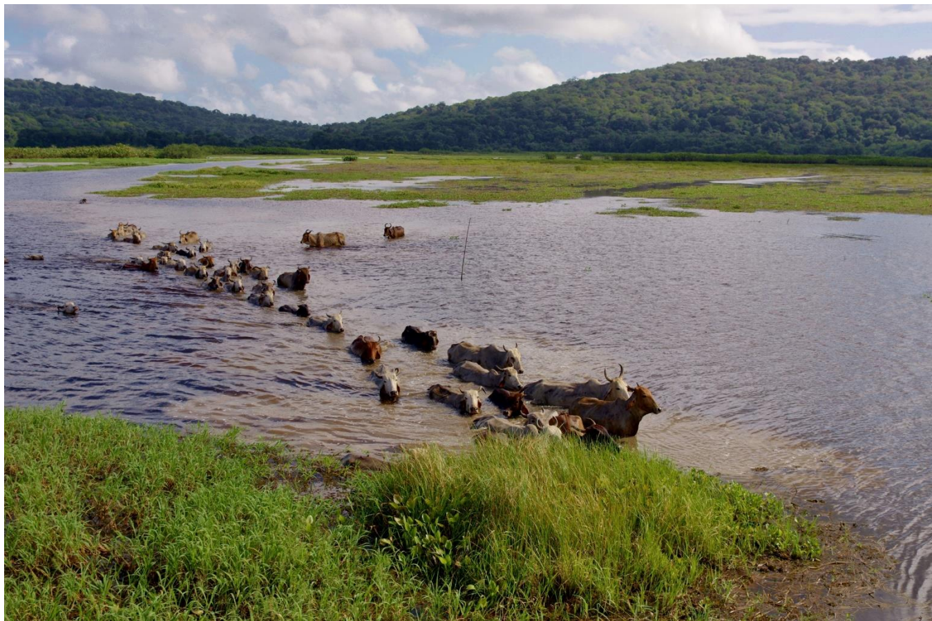
Elevage bovin, Réserve naturelle de Kaw-Roura