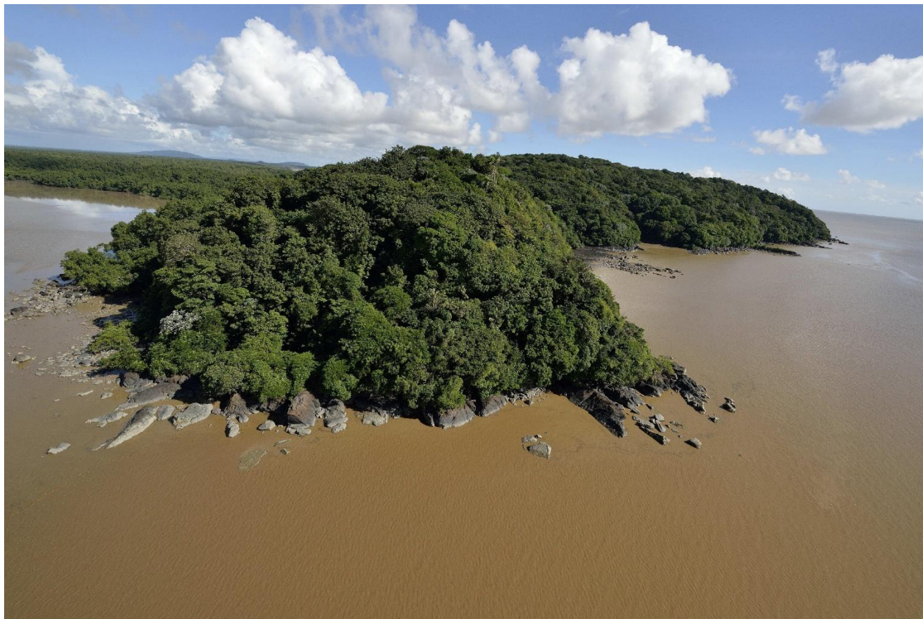
3. Montagne d'Argent, Ouanary