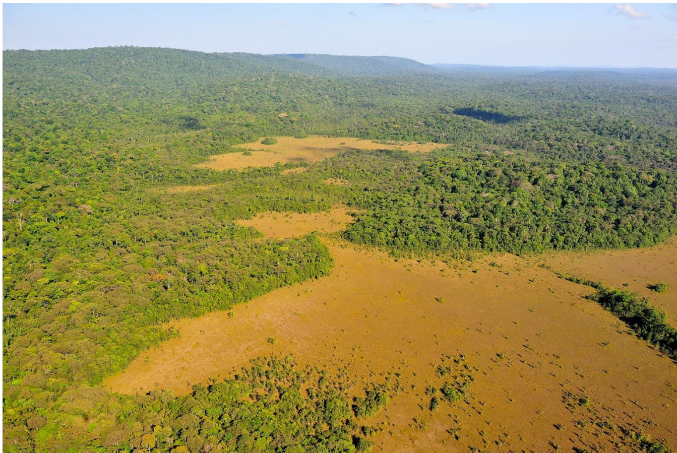
4. Savanes dans la Réserve naturelle régionale Trésor, Roura