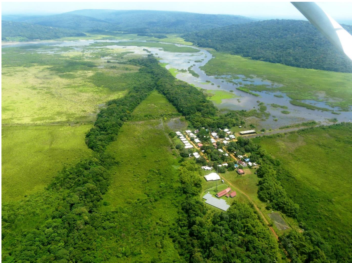
10. Bour de Kaw et Réserve naturelle de Kaw-Roura