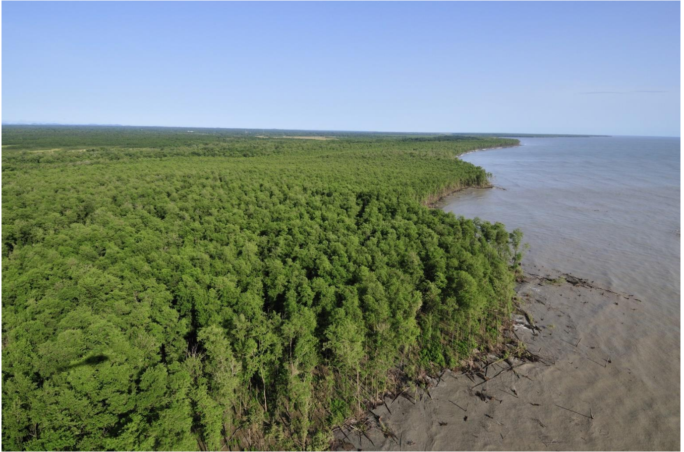
Mangrove littorale sur la côte du Centre Spatial Guyanais