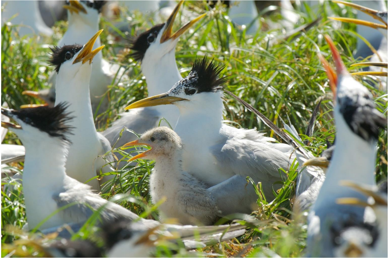
9. Sterne de Cayenne, Réserve naturelle de l'île du Grand Connétable