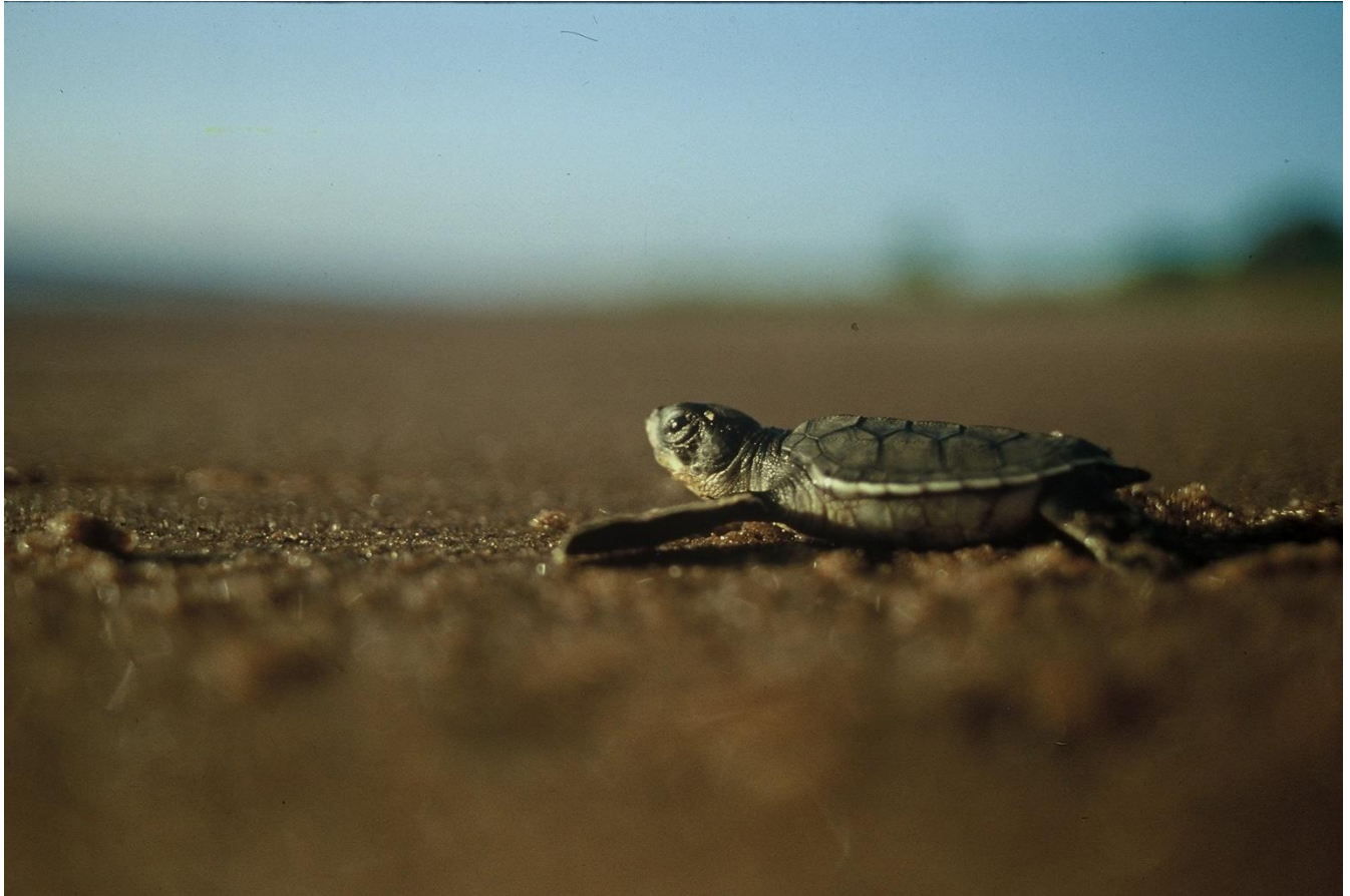
21. Tortue verte juvénile, Chelonia mydas, Réserve naturelle nationale de l'Amana