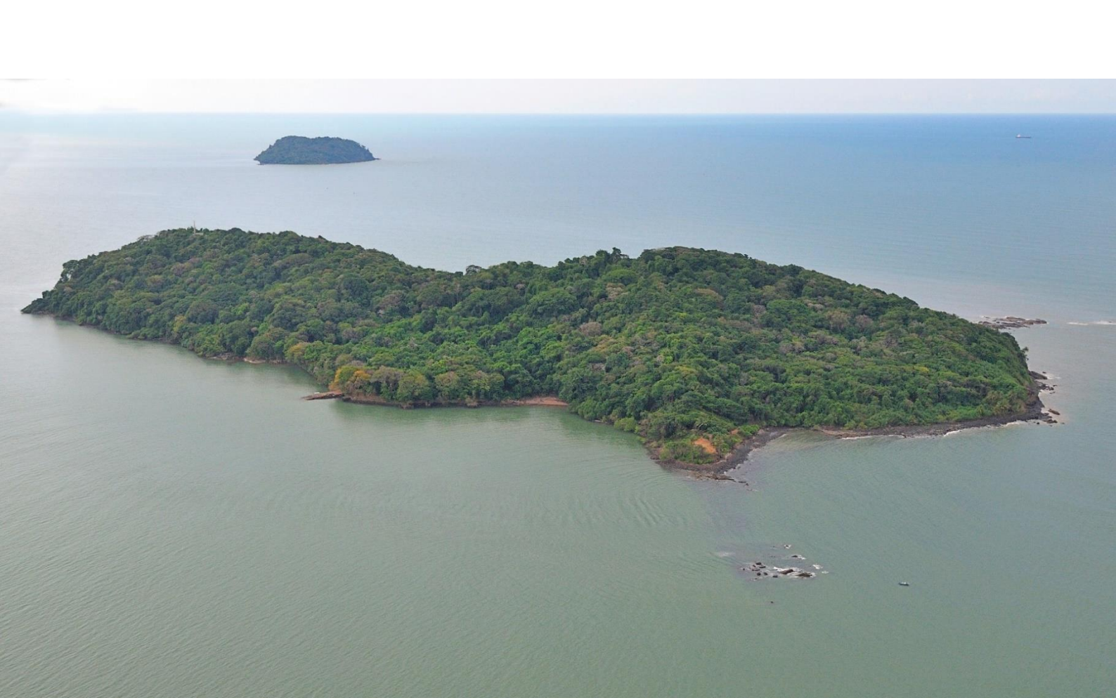
17. Îlet la mère