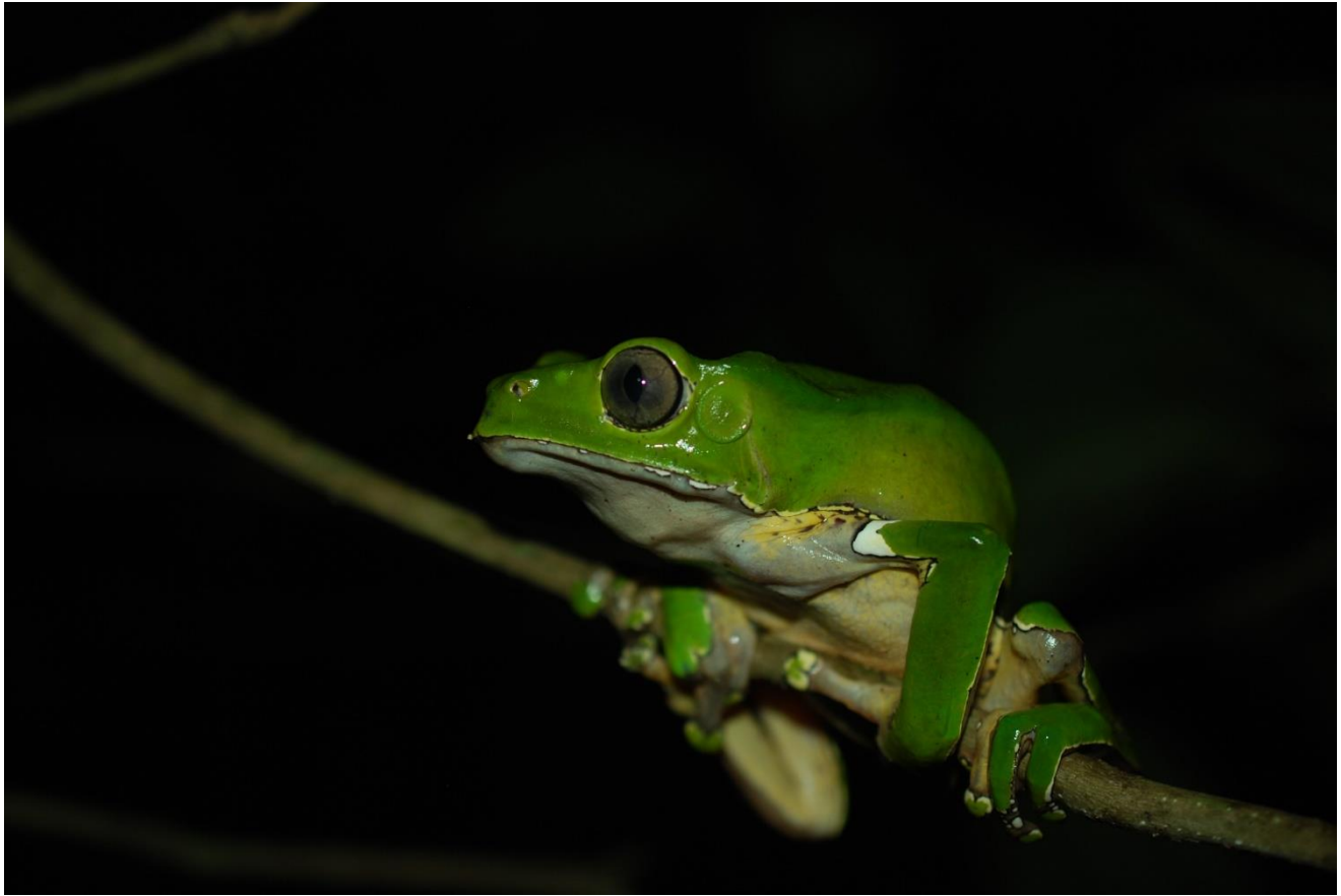
Phyllomedusa bicolor , Réserve naturelle de Kaw-Roura