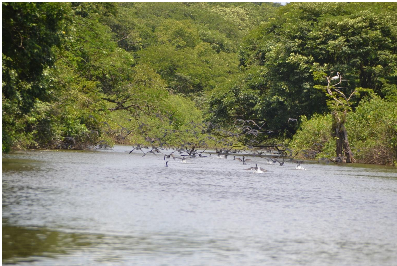
11. Envol de Cormorans Phalacrocorax brasilianus , Crique Wapou - Ti rivière, Réserve naturelle de Kaw-Roura