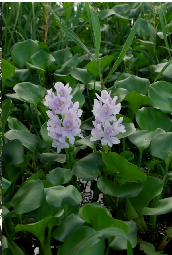
16. Flore de la réserve naturelle de Kaw-Roura : Montrichardia (moucou-moucou), Pterocarpus (moutouchi), Eichornia (jacynthe d'eau)