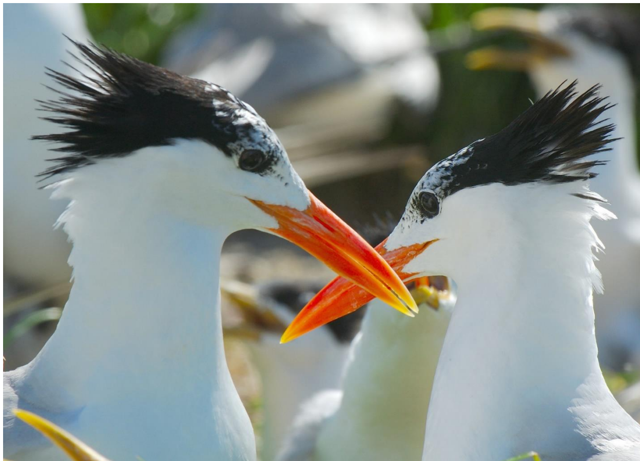
Sterne royale, Réserve naturelle de l'île du Grand Connétable