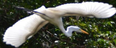
Grande Aigrette, Ardea alba, Réserve naturelle de Kaw-Roura