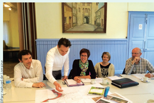
Patrimoine naturel et culturel sur la table à la réunion de démarrage du PLU avec volet patrimonial à Fénétrange

L'Inventaire général du patrimoine culturel est un service opérationnel de recherche appliquée. Il identifie puis étudie le patrimoine architectural et mobilier sur un territoire ou une thématique puis diffuse le résultat de la recherche à l'intention des habitants, des visiteurs ou des aménageurs. Ses opérations montrent les liens entre les éléments patrimoniaux et éclairent le contexte géographique, historique et sociologique. C'est une ressource multithématique pour élaborer des projets à toutes les échelles.