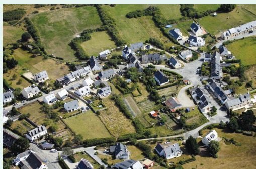
Exemple de secteurs de potentiels fonciers en zone urbanisée

L'identification du potentiel foncier dans les enveloppes urbaines s'inscrit dans un contexte où la lutte contre l'étalement urbain, la protection du foncier agricole et des