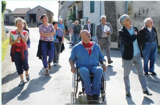
Les « Rencontres de l'Atelier » permettent la constitution d'une culture commune de la qualité des projets

L'Atelier d'urbanisme du Parc naturel régional Livradois-Forez accompagne, depuis 2013, les communes et EPCI dans l'élaboration de leurs projets. Grâce à la cellule d'appui technique* créée au sein du Parc et au collectif de partenaires**, 70% des communes du Parc ont déjà bénéficié de ce soutien au travers d'un conseil ou d'un appui technique (250 projets