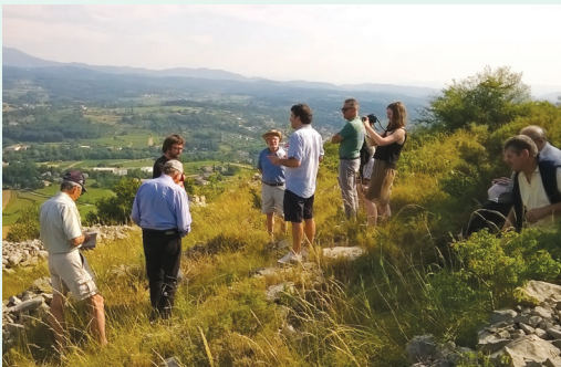
Atelier itinérant pour construire une stratégie paysagère et le futur PLUi de la communauté de communes Beaume-Drobie.

Pour l'élaboration de leur PLUi, deux intercommunalités sont accompagnées par le Parc naturel régional des Monts d'Ardèche , à travers l'élaboration d'une stratégie paysagère : cette approche transversale et de terrain amène à la fois des conseillers municipaux et communautaires sur des ateliers itinérants ; ces temps de travail in-situ permettent aux