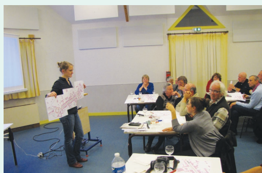
Cartographie participative avec les habitants afin d'identifier leurs usages et recueillir leurs propositions

Le Parc naturel régional de Normandie-Maine a accompagné la commune de Pré-en-Pail-Saint-Samson (53) dans sa revitalisation de