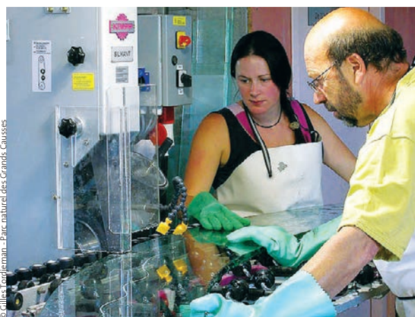
© Gilles Tardjeman - Parc naturel des Grands Causses

Cette catégorie de coworkers intermittents révèle à notre sens la porosité actuelle - sur un plan spatial comme temporel - induite par les outils numériques, entre la sphère professionnelle d'une part et la sphère personnelle d'autre part. D'ailleurs, que ce soit ou pas au sein d'un tiers-lieu, il est désormais difficile à notre époque hyper-connectée, de savoir si tel individu devant son écran d'ordinateur (sur sa tablette, sur son smartphone), travaille et/ou s'adonne à d'autres activités.