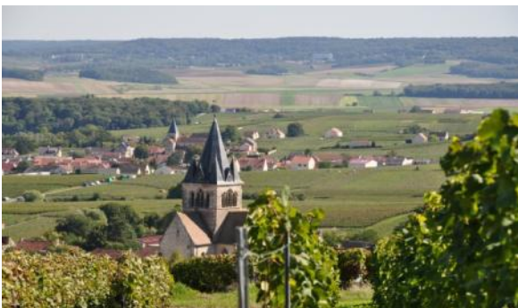
Les coteaux viticoles de la Montagne de Reims