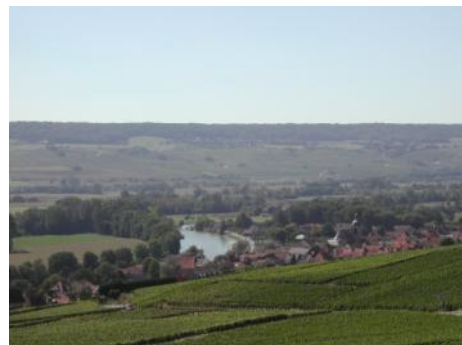
La vallée de la Marne