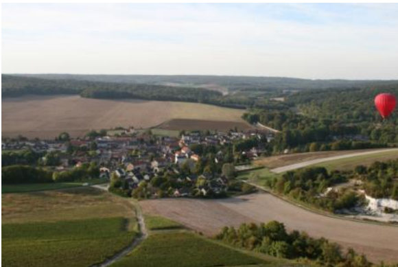
Le massif forestier de la Montagne de Reims