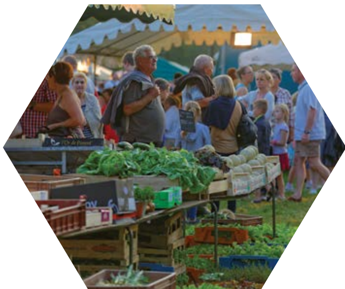
Marché nocturne d'Eppe-Sauvage

Au sein de la 3CA la volonté de continuer à maintenir et entretenir le bocage est là, mais il est essentiel de trouver de nouveaux financements pour que ces politiques perdurent en attendant que le bocage devienne, par lui-même, une vraie valeur économique, notamment avec la filière bois énergie.»