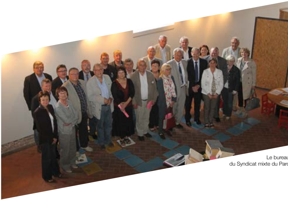
Le bureau du Syndicat mixte du Parc