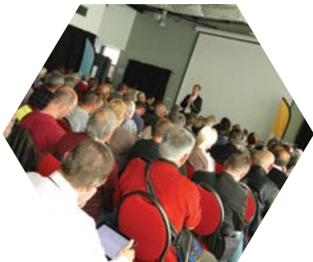
Accueil des nouveaux délégués - juin 2014

Le Bureau du Syndicat mixte du Parc compte 14 membres élus parmi les membres du Comité Syndical. Le Bureau délibère sur les questions pour lesquelles il a reçu délégation spéciale du Comité Syndical. Il prépare les Comités Syndicaux, rend les avis (PLU, études d'impact...).