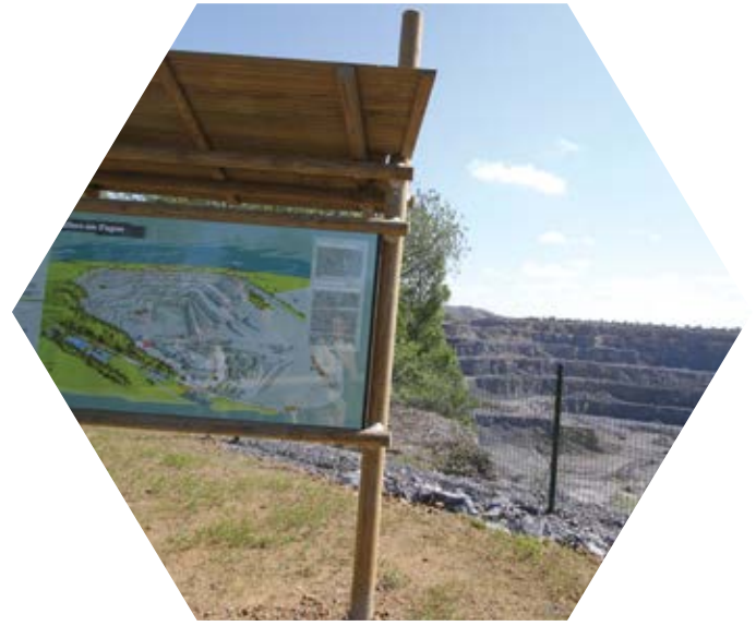
Le belvédère, carrière de Wallers-en-Fagne