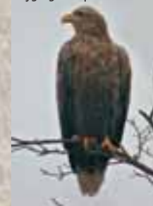
Pygargue à queue blanche

Durant toute l'année, lacs et étangs vous permettent d'observer, Grèbe huppé, Foulque macroule, Héron cendré et Cygne tuberculé, facilement identifiable..