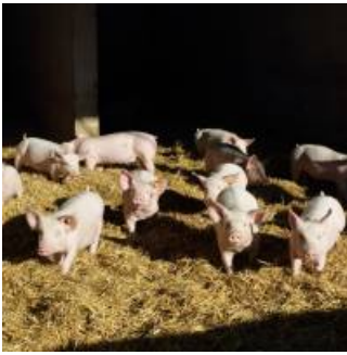
Coup de coeur