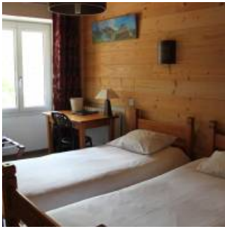
Coup de coeur

Un restaurant qui accueille les visiteurs tout au long de l'année dans un intérieur chaleureux ou sur une terrasse fleuri du plus bel effet, dès que la météo le permet.