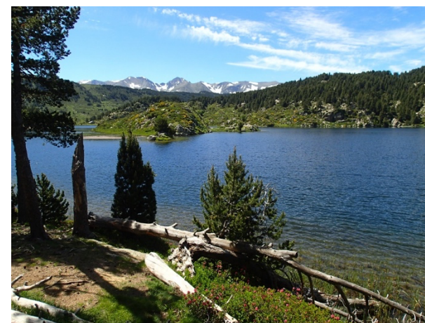
Estany de la Pradella - OPIE