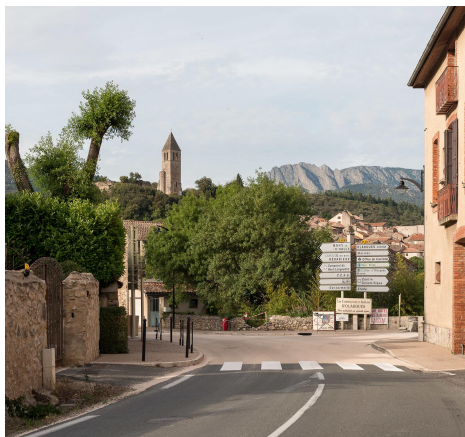
Olargues PNR Haut-Languedoc