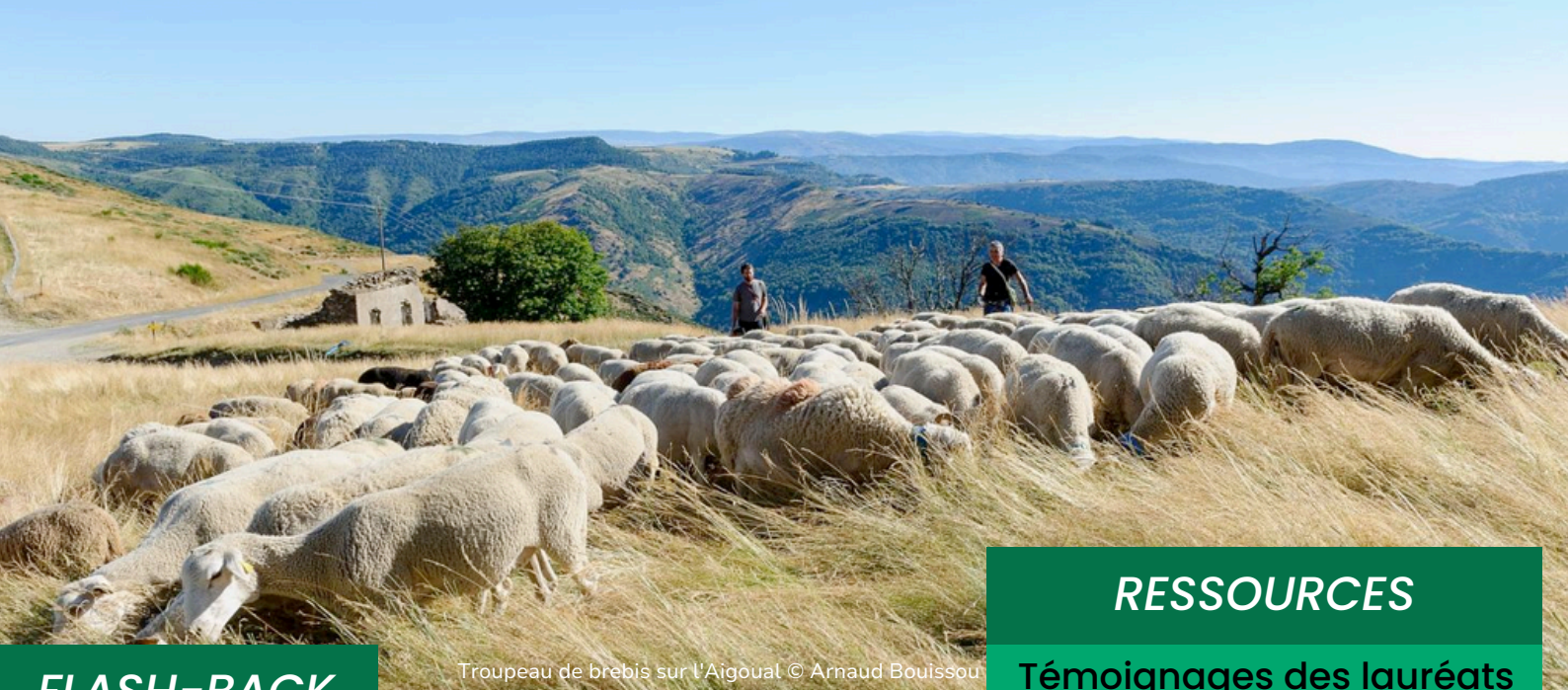
Troupeau de brebis sur l'Aigoual © Arnaud Bouissou