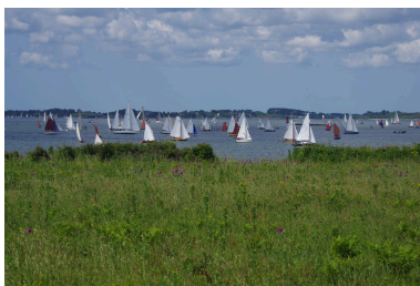
Semaine du Golfe

Séminaire accueilli par le Parc naturel régional du Golfe du Morbihan et la Fédération des Parcs naturels régionaux de France, co-organisé avec le Parc naturel régional d'Armorique