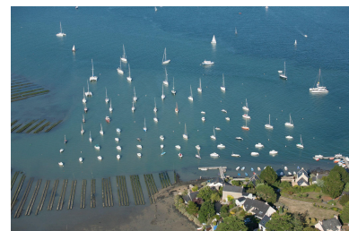
Zones aménagées sur le littoral