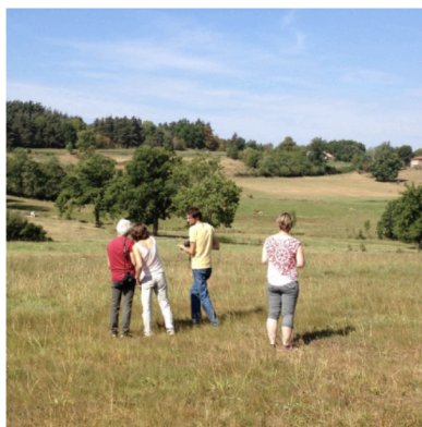
Pnr du Liradois-Forez

MOTS-CLÉS : plans de paysage, méthodologie et retours d'expériences