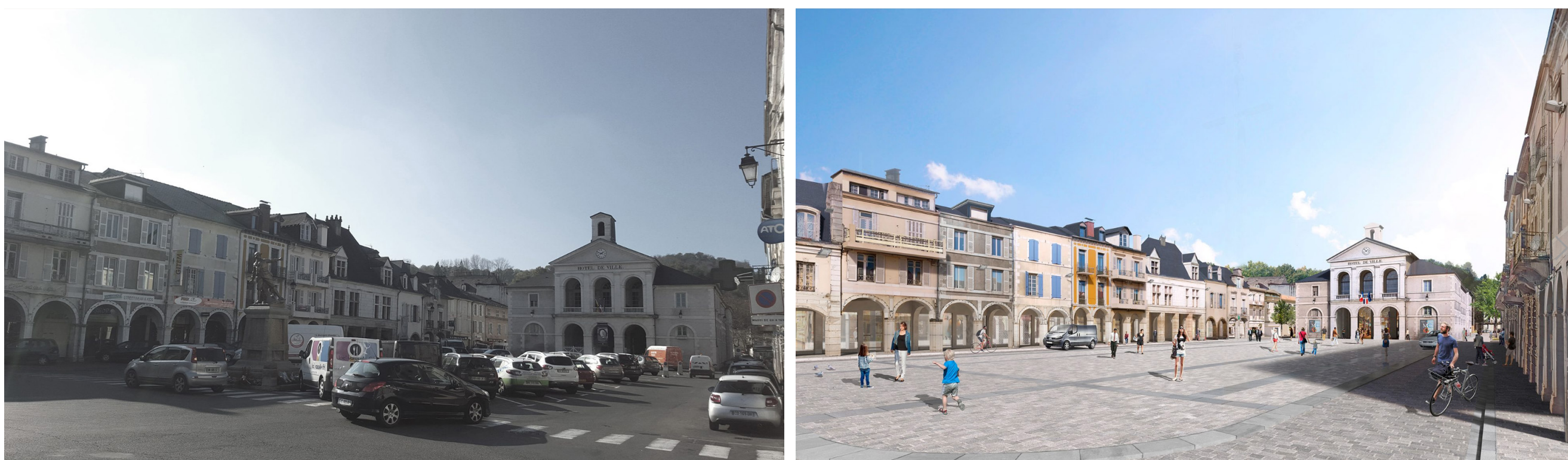
Révitilisation du centre bourg de Nay (département Pyrénées Atlantiques) Architecte/urbaniste Mandataire : Atelier Cité Architecture

CRÉATION DE LOGEMENTS ÉPHÉMÈRES POUR TOURISTES