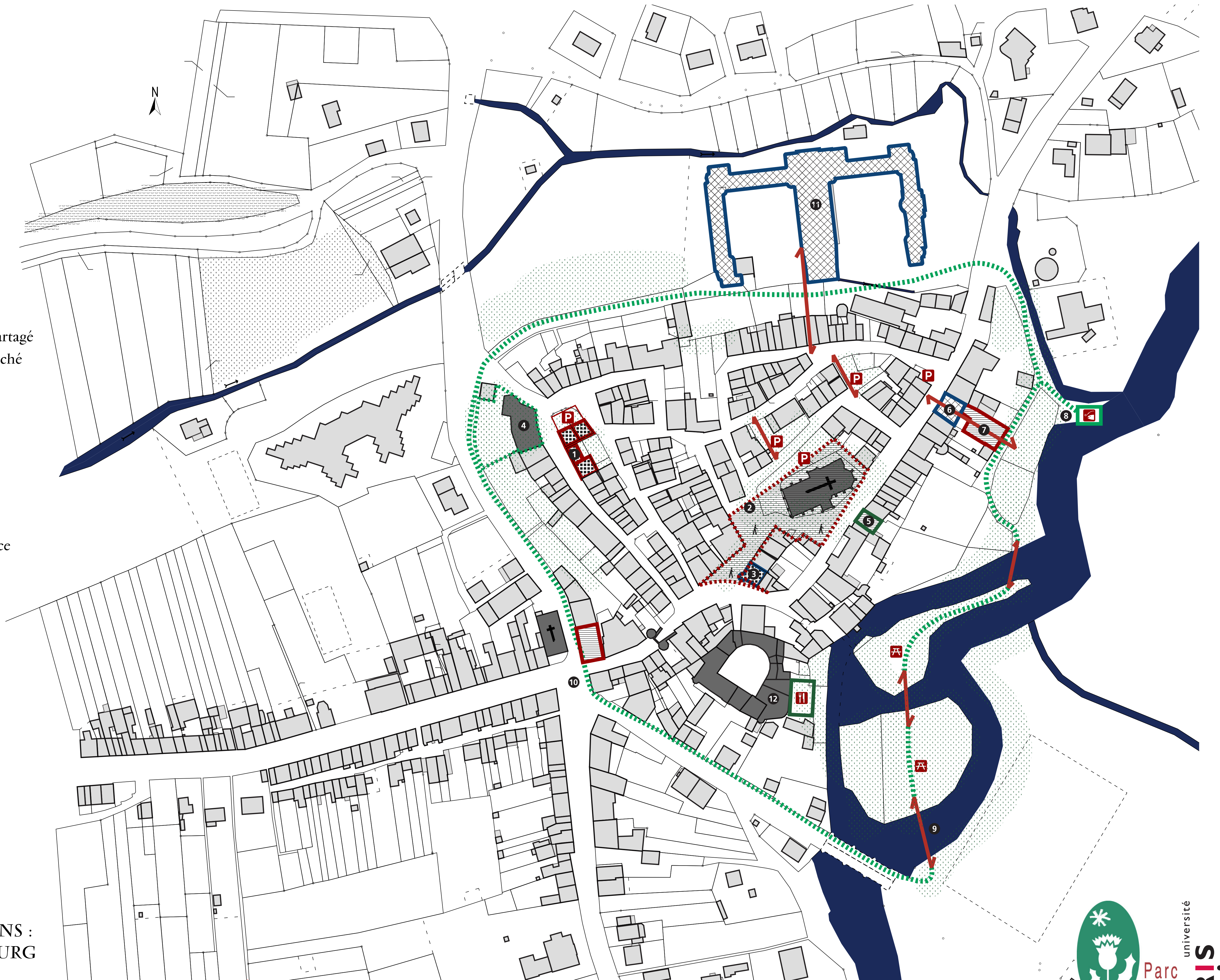
CARTE DES PROPOSITIONS : HABITER LE CENTRE BOURG