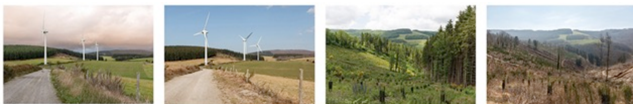
Observatoire Photographique du Paysage du Parc naturel régional du Haut-Languedoc. 2013, 2015