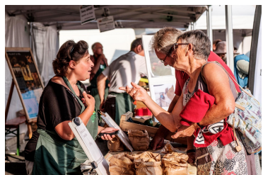
Kreazim - PNR Loire Anjou Touraine