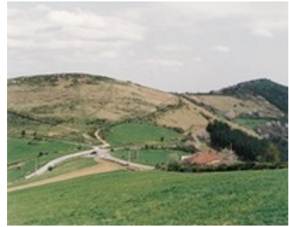
Observatoire Photographique du Paysage du Parc naturel régional du Pilat (Itinéraire 1). Valla-en-Gier (42) - Col de la croix du Planil : 1993, 1997, 1999.

Dans le Parc du Pilat, l'Observatoire Photographique du Paysage, dont la création remonte à 1993 et qui constitue l'une des démarches les plus abouties, fait notamment office de support de discussion et de négociation auprès de la profession agricole. Le Parc l'emploie également en tant que lanceur d'alerte sur les secteurs le plus soumis à l'enfrichement et aux différents usages agricoles.