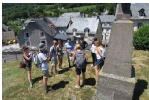
Balade paysagère, centre-bourg de Condat, 11.07.18

Le Syndicat mixte du Parc naturel régional des Volcans d'Auvergne a lancé en mai 2018 son Plan de paysage « Vallée de la Rhue et Val de Sumène ». Les élus, habitants et acteurs locaux des 9 communes cantaliennes concernées sont invités à participer à cette démarche originale et conviviale basée sur le thème du voyage.