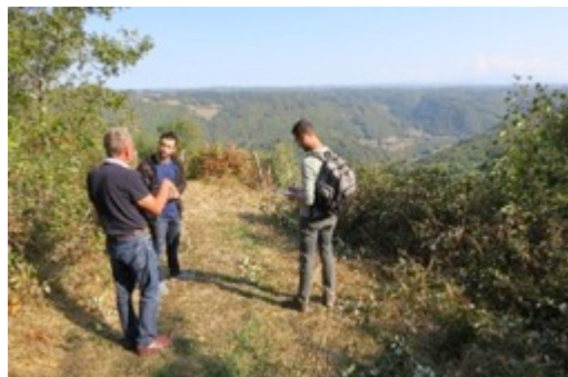
Rand'auto, point de vue sur Embort et la Vallée de la Rhue, 11.09.18

Pour cela, un collectif d'architectes et de paysagistes « 1 pas de côté, Bureau B02 et Les Andains » a été choisi pour réaliser ce Plan de paysage à travers la mise en place de plusieurs dispositifs participatifs. Des balades paysagères, rand'autos (randonnées en voiture avec des habitants) et des résidences sur le territoire ont eu lieu cet été de juillet à septembre 2018. Des auberges du voyageur (ateliers), rencontres et débats sont également prévus.