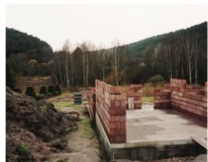
Observatoire Photographique du Paysage du Parc naturel régional des Vosges du Nord (Itinéraire 11). Site 41, Philippsbourg : 2000, 2005, 2016.