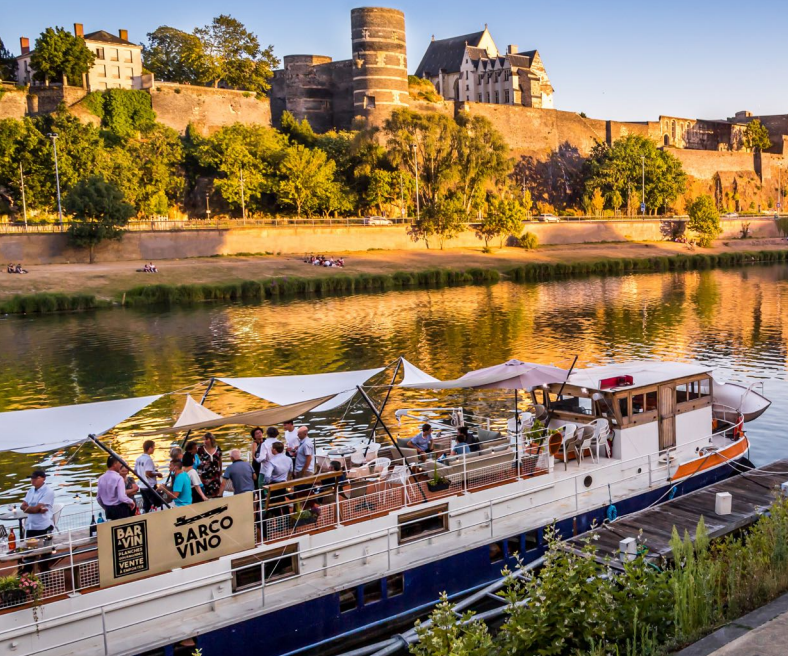
Quai des Carmes le long de la Maine à Angers (Maine-et-Loire)