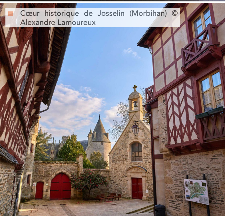
Cœur historique de Josselin (Morbihan)