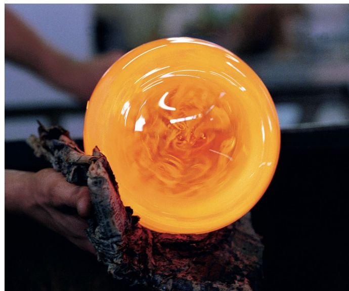
■ Opération de maillochage par un artisan verrier de Biot (Alpes-Maritimes)

Révéléateur de bijoux méconnus, ce voyage illustre l'exceptionnel tableau dans lequel se retrouvent les quelque 2 000 sites membres des associations regroupées au sein de France. Patrimoines & Territoires d'exception . Il donne à chacun la possibilité de voir et comprendre leur équilibre fragile au fil du temps.