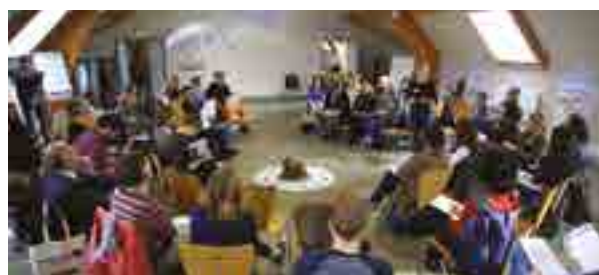
Forum ouvert © PNR Scarpe-Escaut