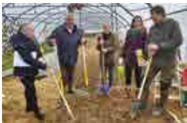
Créer un collectif d'acteurs

Et des facteurs propices à la création de IARD :