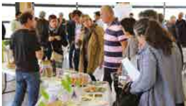
Le Marché d'intérêt local présente ses produits au forum pour l'approvisionnement local du Perche.