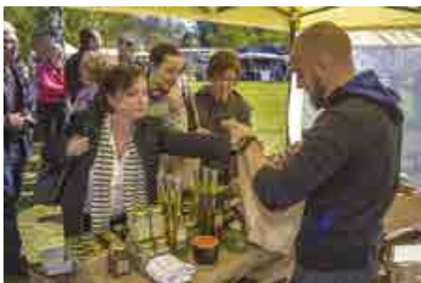
Épicerie Dossmann

Pour contrebalancer les impacts du système alimentaire dominant, caractérisé par son excès d'agro-industrialisation et de mondialisation, de nombreux acteurs présents sur les territoires des Parcs s'engagent sur le chemin d'une transition agricole et alimentaire. Ces acteurs de tous les maillons de la chaîne agricole et alimentaire ont des pratiques vertueuses, pourvoyeuses d'externalités positives sur les plans sociaux, environnementaux, culturels, pédagogiques ou en termes de développement local. Le processus d'observation porté par la Fédération des Parcs naturels régionaux et RESOLIS permet d'identifier et de valoriser ces expériences qui ont un rôle majeur dans la construction d'une « pédagogie de la transition » : une pédagogie de l'exemple concret, basé sur le partage d'expériences entre pairs, entre acteurs moteurs de la transition.