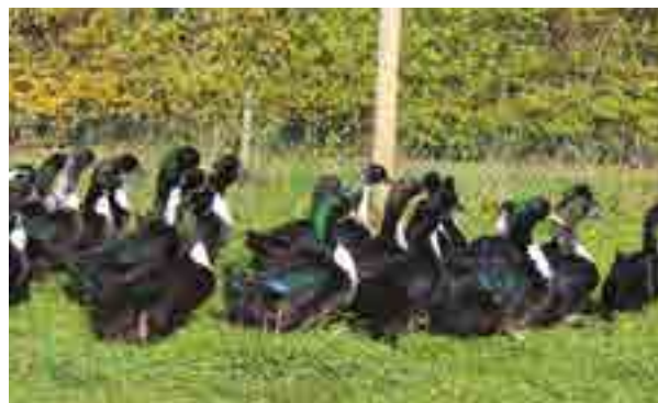
Le canard Duclair, un enjeu à la fois culturel, pédagogique et économique

Le volet des enjeux culturels, très représenté, peut être mis en lien avec le caractère remarquable des Parcs naturels régionaux. En effet, ne peuvent être classés « Parcs naturels régionaux » que les territoires à dominante rurale aux patrimoines culturels et naturels riches. Il existe donc des savoir-faire vernaculaires reconnus et fortement ancrés dans le territoire, des moyens d'animation dédiés à leur valorisation et des porteurs de projets potentiellement plus sensibilisés à ces enjeux que dans d'autres territoires.