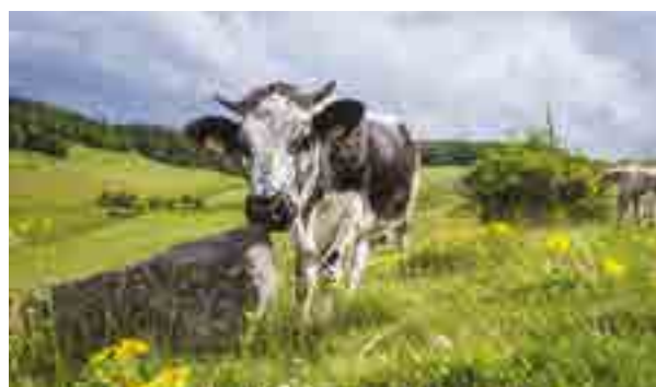
Vache vosgienne

En majorité, les Parcs ont recruté des étudiants en stage de master 2 pour une durée de 4 à 6 mois à temps plein ou partiel pour le recensement d'initiatives, co-encadrés à distance par RESOLIS tout au long de leur mission. Certains chargés de missions préfèrent cependant mettre en œuvre directement la méthode pour être en prise directe avec les acteurs de leur territoire.