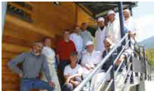
L'abattoir des 3 Vallées, repris par un collectif d'usagers regroupés en SCIC souhaite maintenir, voire légèrement développer son activité pour répondre aux besoins locaux.