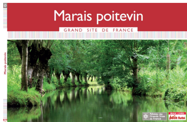
Un label lié au site classé

L'intervention et les échanges mettent en avant un équilibre délicat entre préservation d'un milieu fragile et développement touristique maîtrisé . Le Marais Poitevin apparaît comme un exemple de gestion intégrée , où la coordination des acteurs et la régulation des usages sont essentielles.