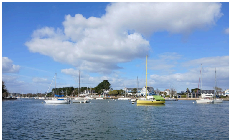
Port dans le Golfe du Morbihan

Enfin, il souligne l' implication de la Fédération , à la fois financièrement dans le séminaire et stratégiquement intéressée par les thématiques abordées.