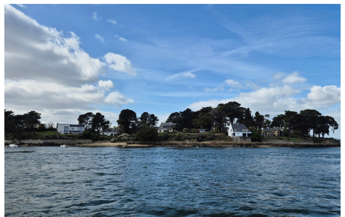
Dans le Golfe du Morbihan

Il commence par des exemples concrets de gestion des espaces littoraux et des conflits d'aménagement . Certains projets (ports, digues, constructions touristiques) sont difficiles à faire annuler, bien que la loi Littoral et les outils de protection puissent parfois les bloquer ou les encadrer. D'autres cas illustrent des situations de démolition et de renaturation de bâtiments exposés au risque côtier (Soulac-sur-Mer, Treffogat, Saint-Germain-sur-Ay), souvent avec des coûts très élevés pour les communes.