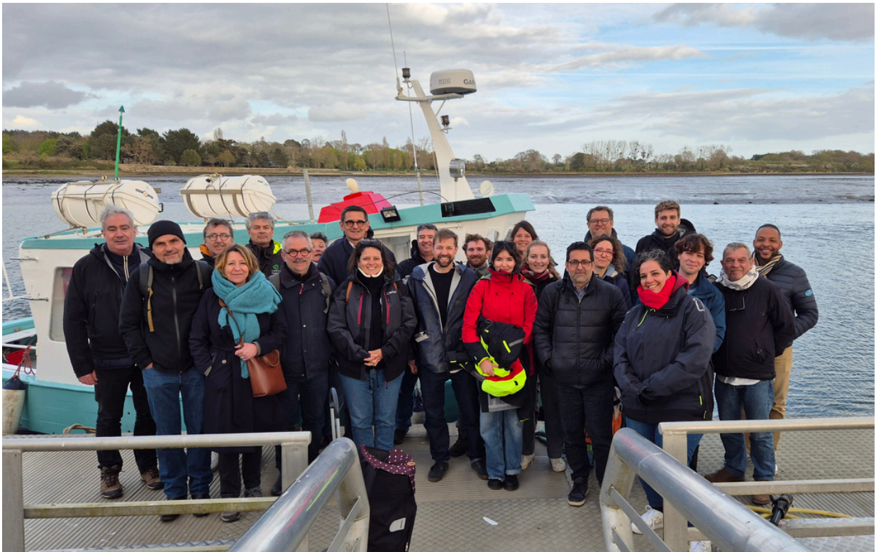
Clap de fin pour le 1er séminaire des Parcs littoraux

L'intervention montre que l'adaptation au recul du littoral est un sujet complexe , à la croisée du droit, de l'urbanisme, de l'économie locale et du financement public, avec des enjeux forts de gouvernance et d'acceptabilité politique.