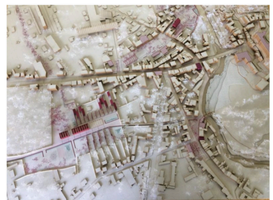
Les cahiers du DSA © ENSA Paris-Est, 2026