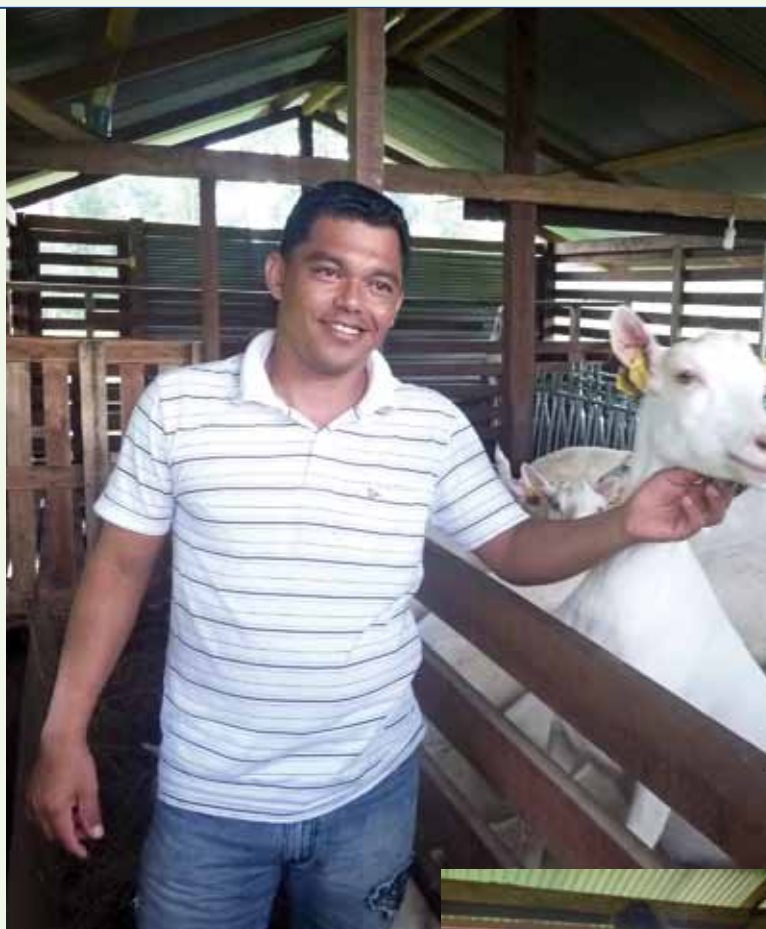
Ph. A. Silva Soares