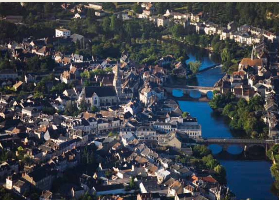
Urbains ou ruraux, tous les milieux doivent pouvoir accueillir une trame verte et une trame bleue.