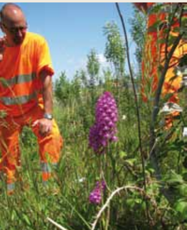
Phi. P. Leisse / PNR des Caps et Marais d'Opale