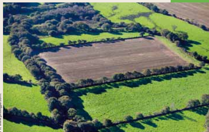
Le bocage, corridor essentiel à la biodiversité.

A l'extrême ouest de la Bretagne, le Parc naturel régional d'Armorique a choisi, lui aussi, de travailler sur un aspect particulier de son paysage, le bocage, en tant que corridor essentiel à la biodiversité, dans une région agricole où les haies et talus ont trop tendance à disparaître.