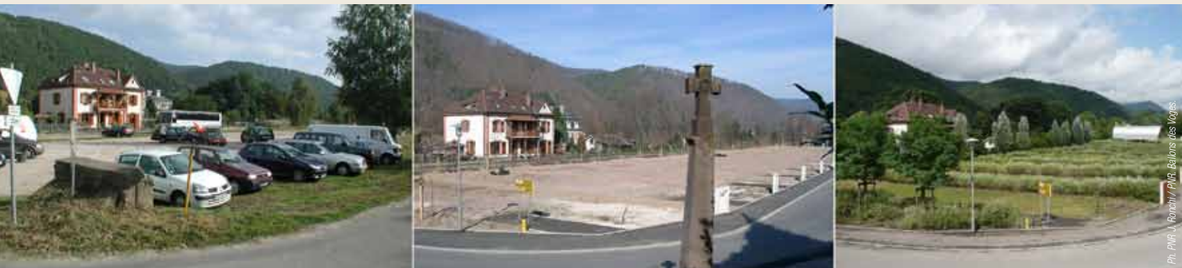
A Sainte-Croix-aux-Mines, la friche ferroviaire faisait barrage à la circulation des espèces. C'est devenu une poche de nature.