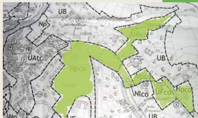
Dans les Monts d'Ardèche un partenariat multiforme permet d'élaborer des documents d'urbanisme adaptés.

Autre démarche pilote, la commune de Jaujac s'est portée volontaire pour prendre en compte les enjeux de biodiversité dans son Plan Local d'Urbanisme. Durant les vingt dernières années, la commune a vu son bourg s'étendre