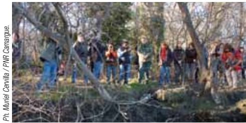
Animation dans le parc de Camargue.

Cette année encore, les Parcs naturels régionaux, associations, Conservatoires d'espaces naturels, organismes publics, se sont mobilisés pour proposer aux curieux, petits et grands, de nombreuses activités (sorties nature, conférences, films, expo, ateliers...) destinées à faire connaître la diversité des zones humides et la richesse de ces écosystèmes qui abritent une grande variété d'espèces végétales et animales. La journée mondiale des zones humides est organisée tous les 2 février pour commémorer la signature de la convention de Ramsar, qui fête cette année ses 40 ans. Une bonne occasion de chausser ses bottes pour découvrir ces milieux si fragiles.