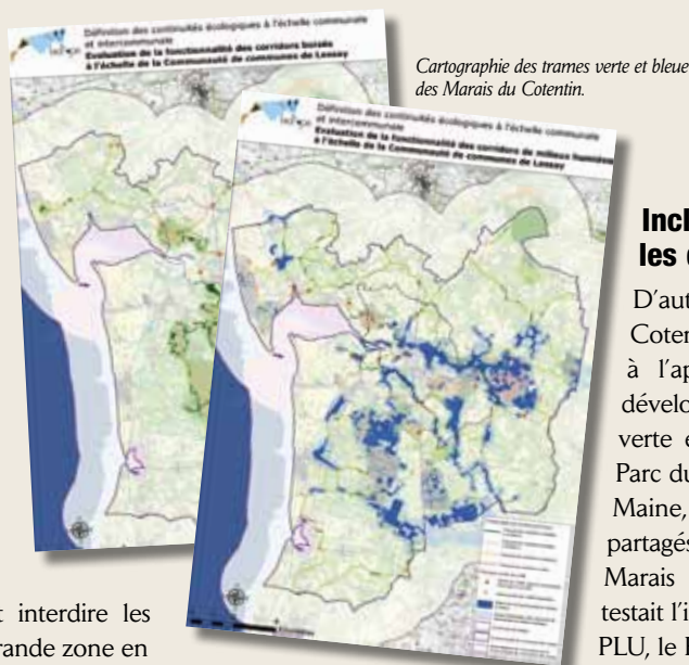
Cartographie des trames verte et bleue des Marais du Cotentin.

Comme beaucoup des parcs qui sont cités dans ce dossier, celui des Marais du Cotentin et du Bessin a noté