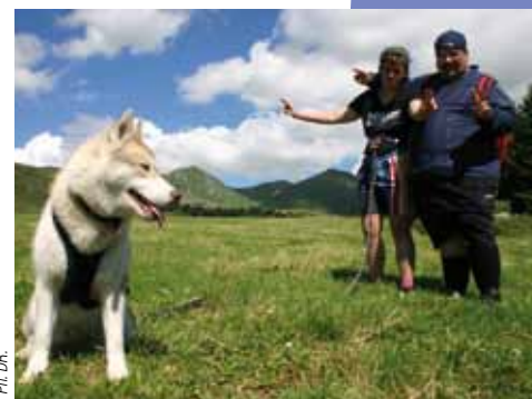
Des séjours scientifiques accessibles aux personnes handicapées.

A défaut de déplacer les montagnes des Volcans d'Auvergne, les fondateurs de Cap Expéditions font bouger les frontières. Celles qui excluent certains publics de certaines activités, faute d'offres adaptées ; celles qui enferment la science dans sa Tour d'ivoire ; ou encore, celles qui figent le champ des possibles, en tentant de renverser les rôles aidés/aidants. ■