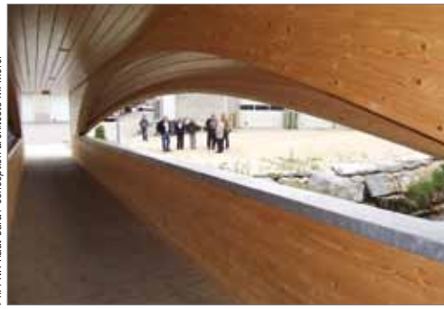
Passerelle sur la Saine - Foncine le Haut

élus...) de mieux connaître la ressource pour l'utiliser ensuite dans les projets constructifs.