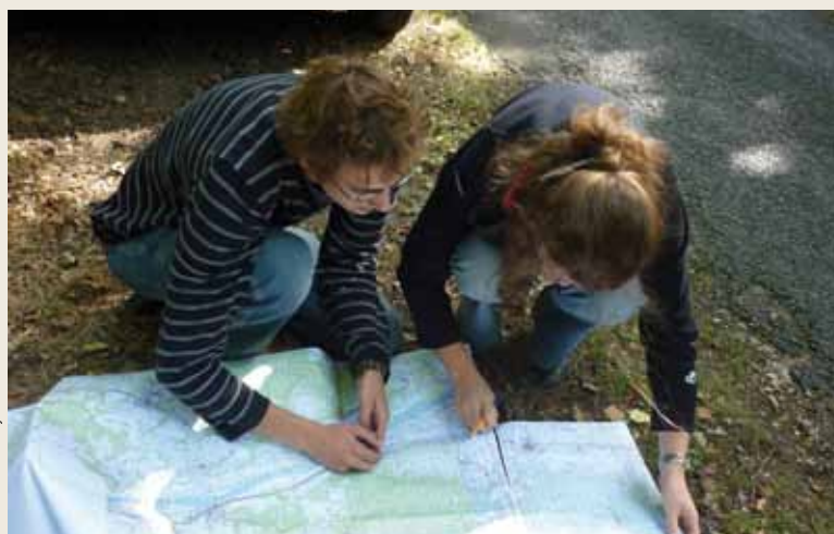
En Loire-Anjou-Touraine, un système d'information géographique pour quatorze unités paysagères différentes.

Ce dernier dossier de la série se présente donc comme une mosaïque d'actions dans des milieux différents et à des échelles différentes, montrant que les Parcs naturels régionaux travaillent à une échelle pertinente, qu'ils ont une approche globale, transversale et concertée du sujet et qu'ils sont organisés pour répondre à tous ces enjeux.