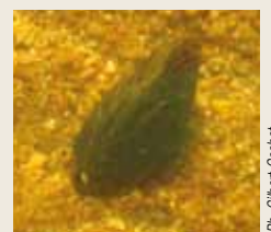
La moule perlière, indicateur de la pollution des rivières sur le plateau de Mille Vaches