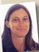
Odile Gauthier, Directrice de l'eau et de la biodiversité Ministère de l'écologie, du développement durable, des transports et du logement

Un centre de ressources TVB se met en place, en soutien des territoires et de leurs initiatives, chargé de capitaliser l'information et les expériences, de fournir des outils et de favoriser la communication. La Fédération des Parcs doit y jouer un rôle majeur, au même titre que l'ATEN et le CEMAGREF ou certains établissements publics, notamment pour l'animation d'un réseau national d'échanges et la publication d'une lettre nationale d'information ■