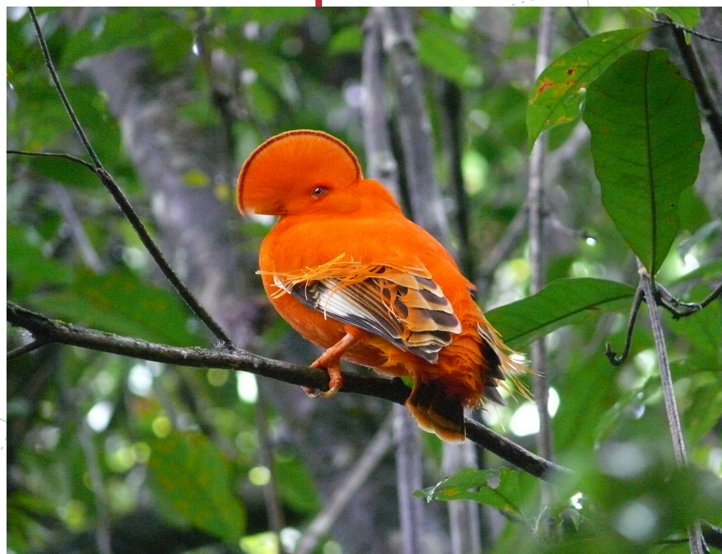
Coq-de-roche mâle : © Maxime DECHELLE

Le massif de Kaw constitue l'un des plus remarquables ensembles paysagers de Guyane. Il présente une importante biodiversité spécifique et fait l'objet de nombreux projets de développement : agricole, minier, forestier, touristique... mais aussi de nombreux statuts de protection.