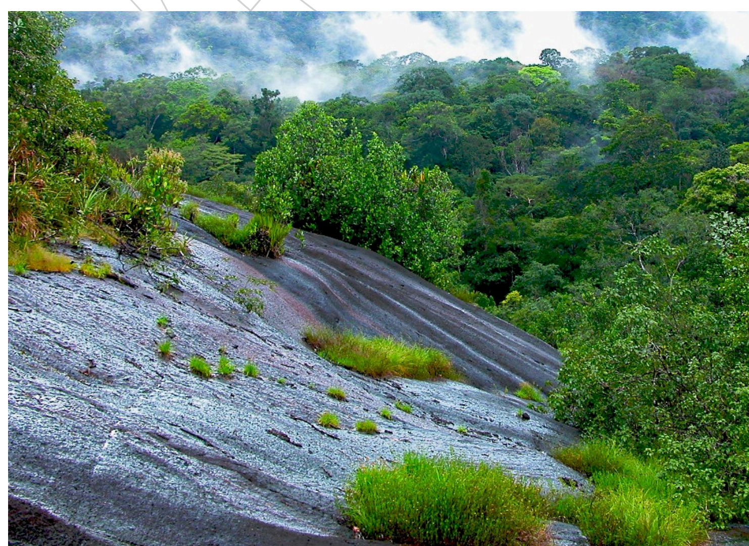
Forêt tropicale humide vue depuis un inselberg, milieu propice aux Coqs-de-roche