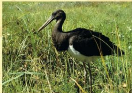
Suwalski Parc Paysager.

Dans le cadre du programme il est notamment prévu: