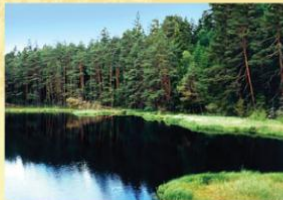
National Parc de Wigry.

La Pologne est en train de définir la liste des sites du réseau Natura 2000. Les projets de sites sont actuellement discutés avec les organes de protection de la nature au niveau des Voïvodies. Ensuite ils seront négociés avec les gestionnaires de ces espaces : Office National des Forêts, Direction des Routes Nationales, Directions de la Gestion de l'eau.