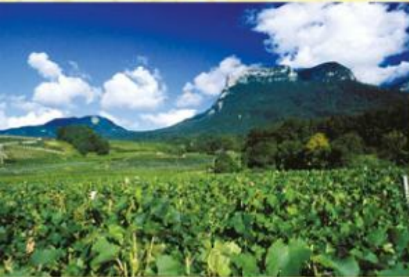
PNR Chartreuse.

Le réseau européen Natura 2000 est un réseau de sites définis et proposés par chaque pays membre de la Communauté Européenne, visant à conserver les espèces ou les habitats menacés, endémiques ou représentatifs de la diversité biologique européenne.