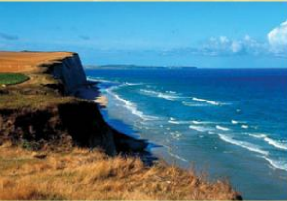
PNR Caps et Marais d'Opale.