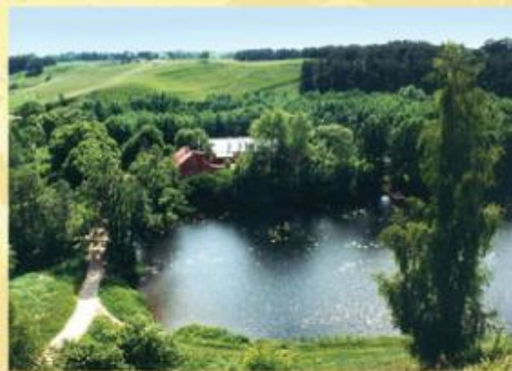
Suwalski Parc Paysager.