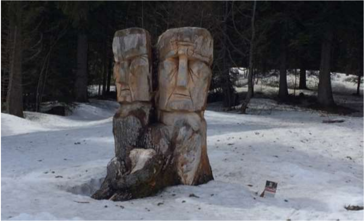
Land-art à proximité de la prairie du Col de Porte

Le projet d'un budget total de 189 K€ est porté par l'ONF avec des financements à 80% de l'Europe (Espace Valléen), la Région (Contrat Parc) et l'Etat (FSIL), mobilisés avec l'appui du PNRC et Grenoble Alpes Métropole.