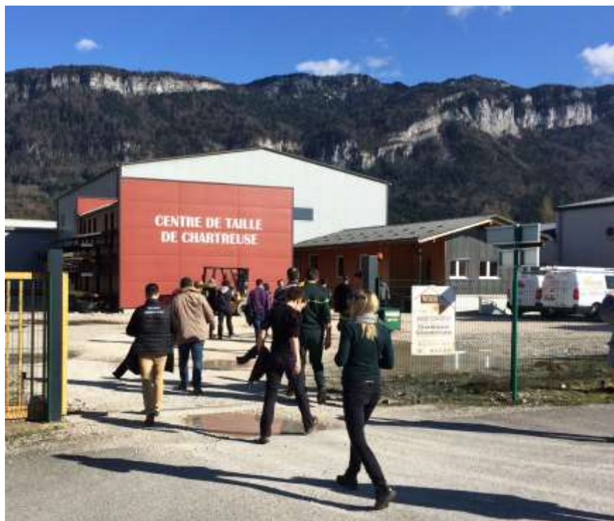
Visite du centre de taille de Chartreuse

La Chartreuse se caractérise par un tissu dense d'entreprises de seconde transformation du bois (charpente). Ces artisans sont nombreux à utiliser des sciages provenant des scieries locales. Cependant, ils ne sont souvent pas assez structurés et équipés pour répondre à des marchés autres que la rénovation et la construction bois chez les particuliers. Pourtant, les collectivités sont de plus en plus nombreuses à être intéressées par les démarches « bois local ». Elles ne trouvent cependant pas sur le territoire des entreprises ou groupement d'entreprises capable de répondre aux appels d'offre et / ou d'être compétitif. Partant du constat qu'il n'existe pas sur le territoire d'outils permettant la taille rapide de charpente et d'ossature, un groupe d'artisans, avec l'appui du Parc, a fait un inventaire des besoins locaux et des potentiels entreprises intéressées.