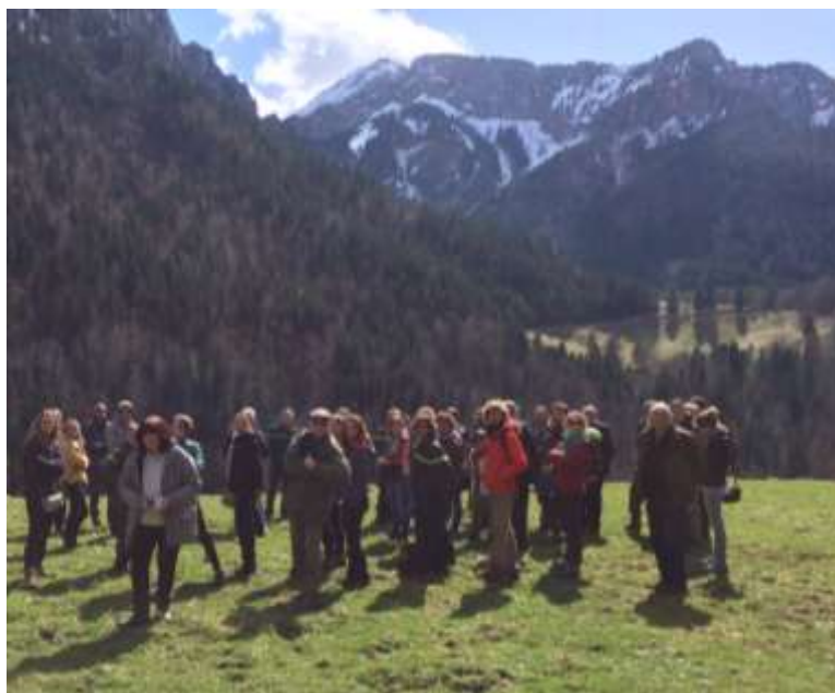
Arrêt sur le site du Monastère de la Grande Chartreuse

Le projet d'amélioration du vallon du monastère de la Grande Chartreuse s'inscrit dans la démarche « Grande Chartreuse, Forêt d'Exception » animée par l'ONF et labélisé en 2015. Le Vallon du Monastère a été défini comme site d'accueil prioritaire du schéma d'accueil élaboré en 2015. Ce patrimoine remarquable possède une forte valeur historique et spirituelle. La sensibilité paysagère du monument et de son environnement est donc particulièrement forte à la fois en terme de préservation et de fréquentation touristique.