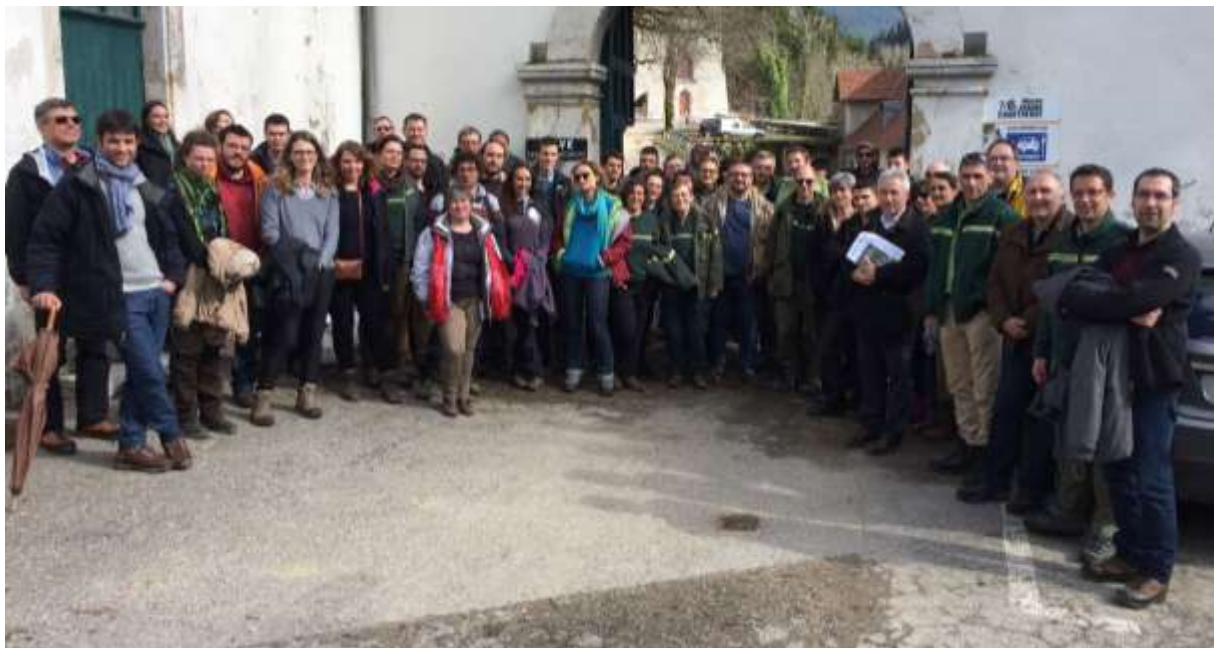
Les participants réunis à l'entrée de la Correrie