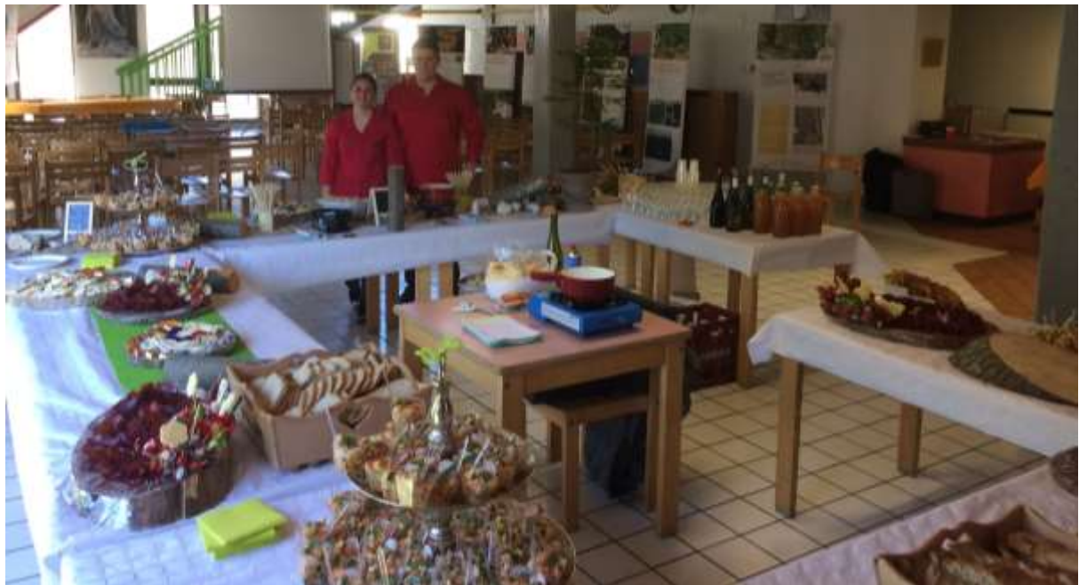
Un magnifique buffet des produits du territoire pour clore le séminaire forêt – filière bois 2018