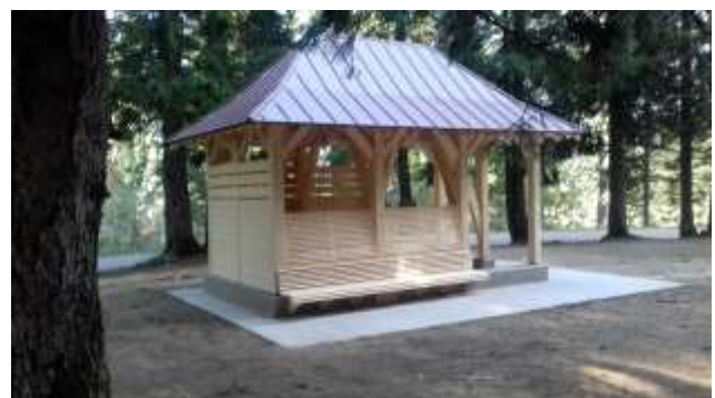
Habert du Col de Porte : du projet à la réalisation, entièrement en bois local de Chartreuse labellisée AOC.