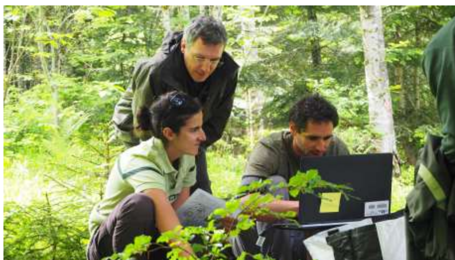
Participants en plein exercice sur le marteloscope du Col de Porte