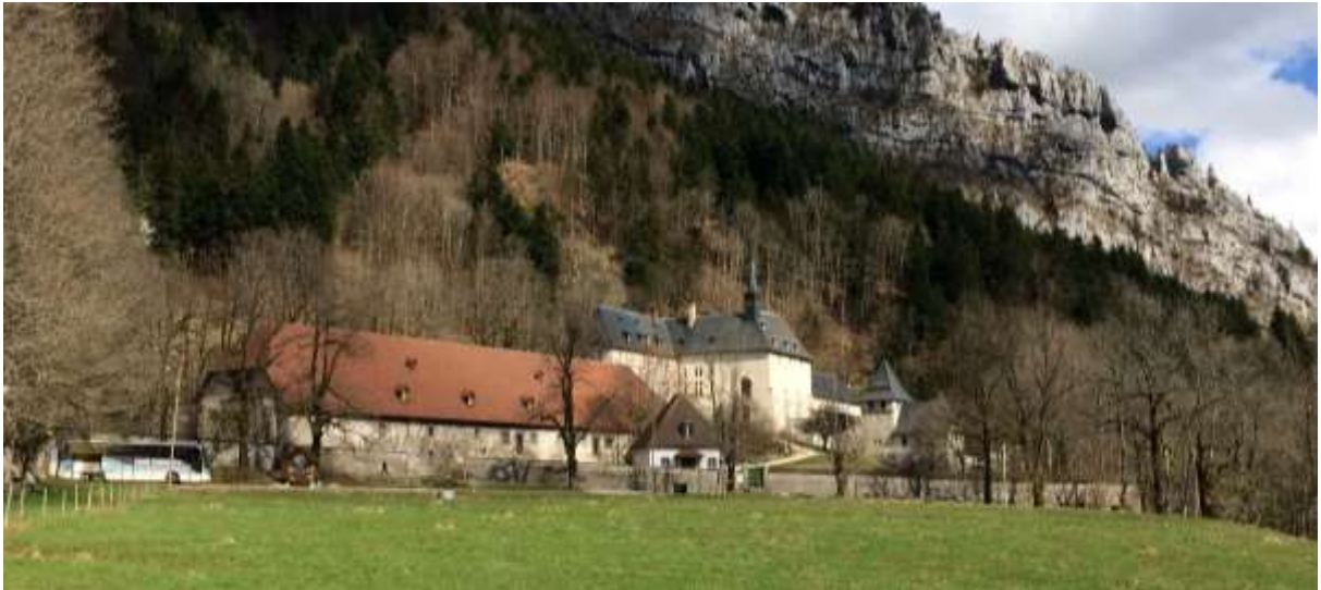
La Correrie du Monastère de la Grande Chartreuse

Les objectifs définis dans le cadre de ces études sont les suivants :