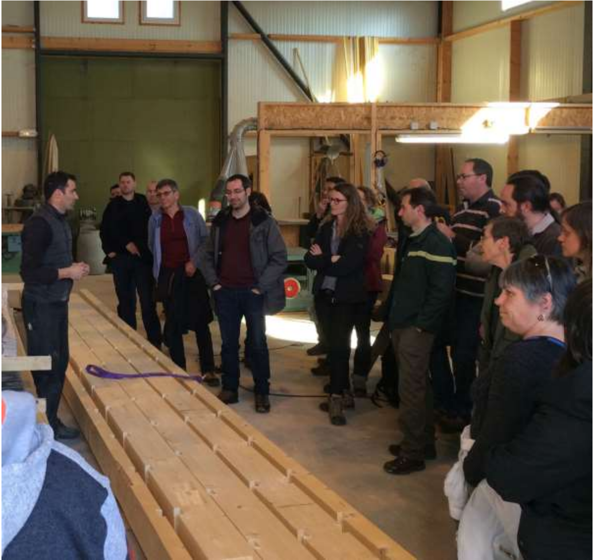
Echange avec l'une des entreprises gérantes du centre de taille

Le Parc a accompagné les professionnels dans :