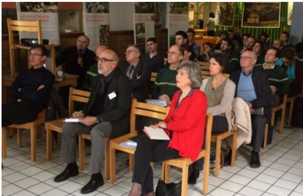
Séance plénière d'ouverture

Dans notre relation au monde végétal, une autre utilisation de la photographie traverse son histoire. C'est le "feuillagisme", nouveau genre ainsi nommé dans les années 1980 mais que l'on retrouve depuis l'origine de la photographie. Cette pratique correspond à une relation qui semble nécessaire à de nombreux photographes. Formelle ou / et métaphysique, en tout cas perceptive, elle semble proche de ce que le philosophe Maurice Merleau-Ponty définit comme une co-naturalité avec nos petits mondes .