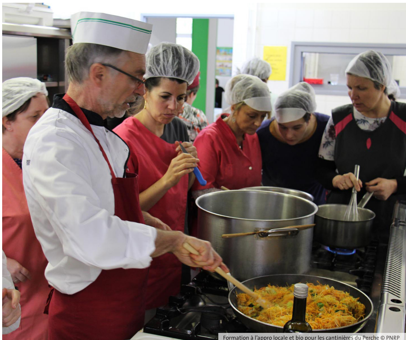
Formation à l'appro locale et bio pour les cantinières du Perche