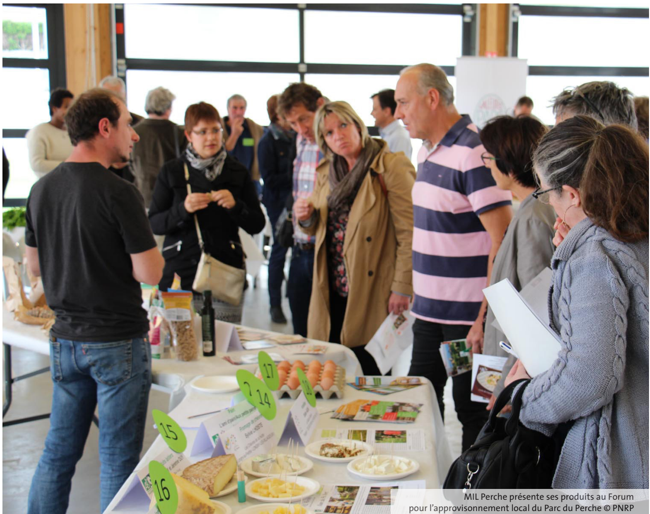
MIL Perche présente ses produits au Forum pour l'approvisionnement local du Parc du Perche