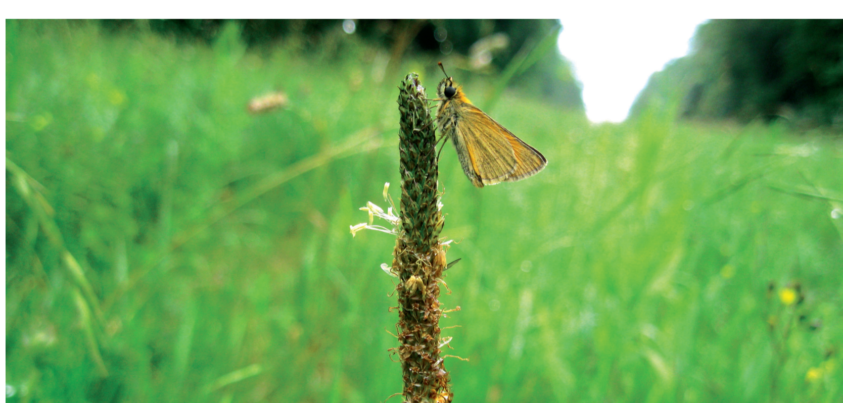
Hespérie de la Houque sur une bande de servitude de GRTgaz

07 Parc de Lorraine • Soutien du « Concours des Pratiques Agro-écologiques - Prairies et Parcours », appelé jusqu'à cette année « Concours des Prairies Fleuries » ; • Inventaires de la biodiversité présente au-dessus des canalisations ; quinze espèces de papillons ont notamment été recensées et un intérêt particulier a été porté aux insectes pollinisateurs ; • Gestion de la biodiversité présente sur le réseau de GRTgaz ; • Édition de fiches de randonnées en partenariat avec la Fédération Française de la Randonnée Pédestre.