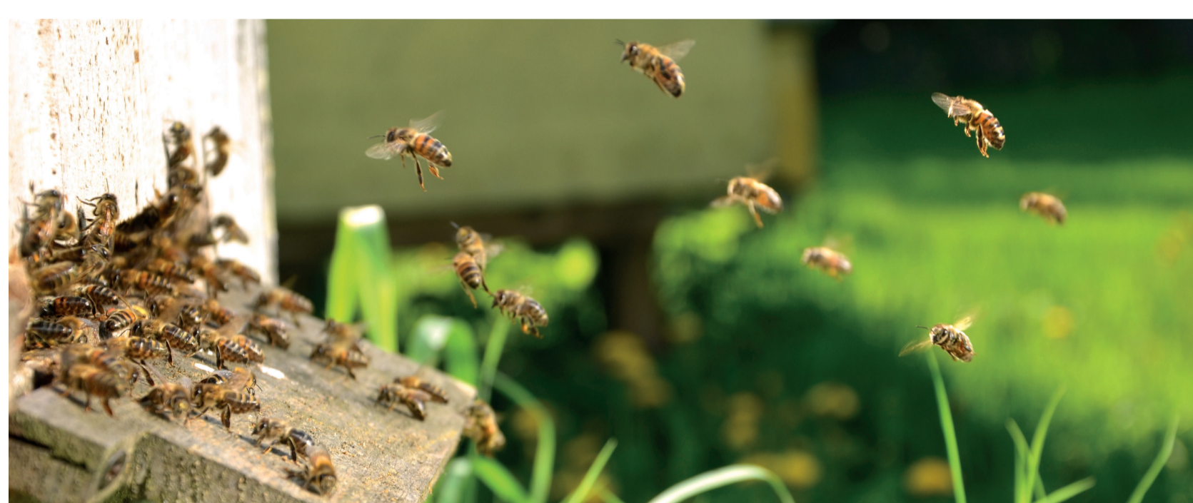
L'installation de 3 ruches intelligentes dans le PNR des Vosges du Nord a été réalisée en partenariat avec GRTgaz

04 Parc des Vosges du Nord • Promotion et développement des bonnes pratiques de gestion des espaces verts dans le cadre du programme « Jardiner pour la Biodiversité » déployé par le SYCOPARC (Syndicat de coopération pour le Parc) ; • Réflexion sur l'adaptation des pratiques de gestion des bandes de servitude ; • Création d'une banque de graines autochtones des Vosges du nord, nécessaire à la bonne restauration des milieux naturels ; • Mise en place ponctuelle d'hôtels à insectes dans les bornes ; • Implantation de trois ruches équipées de systèmes informatisés qui ont permis, en lien avec le centre d'études apicoles de Moselle, d'analyser le comportement des abeilles à proximité du réseau de transport.