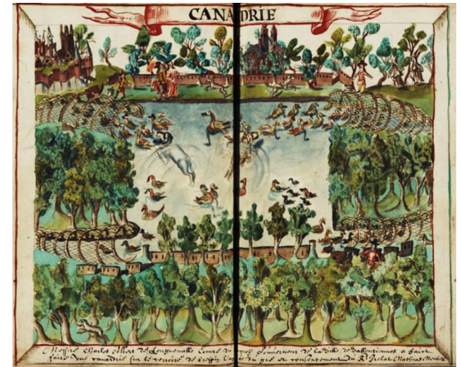
Figure 16 : "Canardrie" de Condé, 17 e siècle, Pierre de Navarre, Antiquité de Valenciennes, Bibliothèque municipale de Valenciennes, Ms 1205, f o 201v-202r.